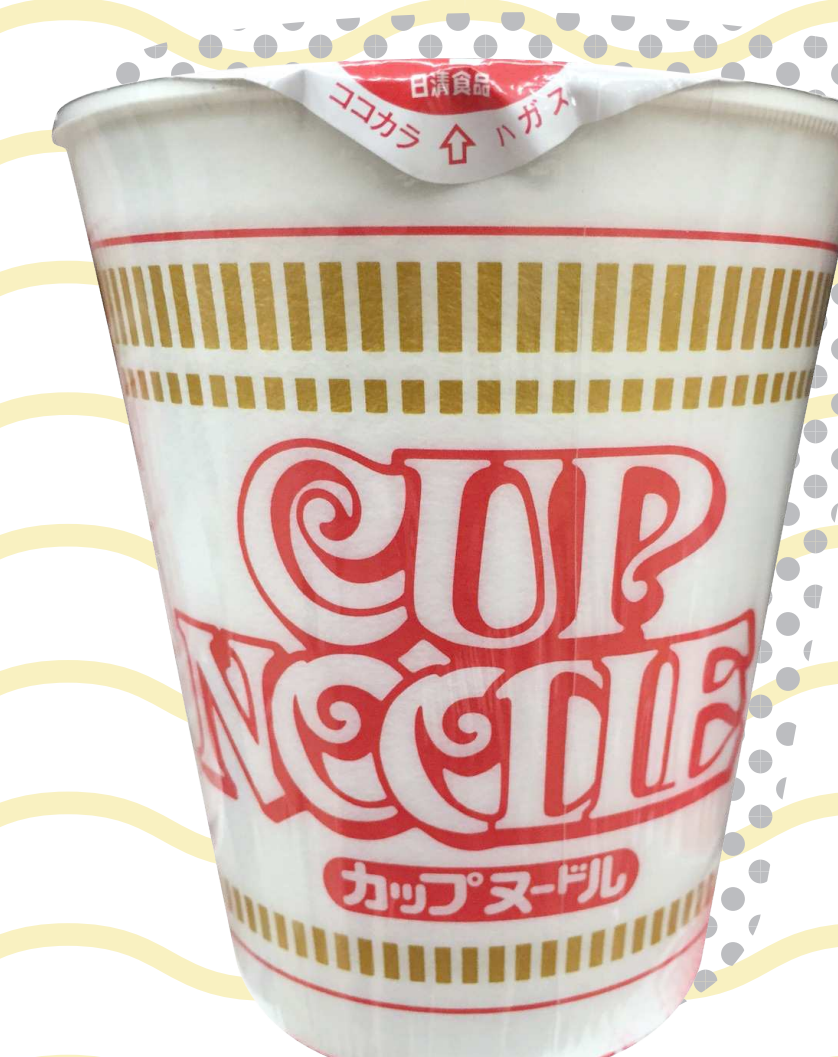
บะหมี่กึ่งสำเร็จรูปแบบถ้วยแรก

บะหมี่กึ่งสำเร็จรูปได้รับความนิยมอย่างล้นหลาม เริ่มจากการขยายความนิยม ไปยังประเทศในแถบเอเชีย จากนั้นจึงแผ่ไปยังฝั่งโลกตะวันตกและรอบโลก จากความต้องการปีละ 15 ล้านซอง ในปี พ.ศ. 2533 (ค.ศ. 1990) ขยับมาเป็น 50 ล้านซอง ในปี พ.ศ. 2554 (ค.ศ. 2011) และทะลุ 100 ล้านซองในปี พ.ศ. 2555 (ค.ศ. 2012)