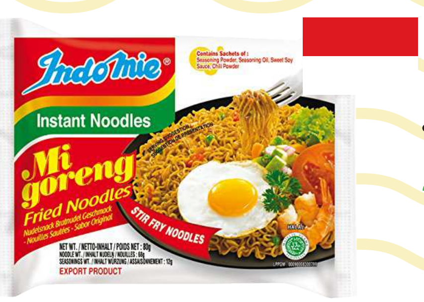
บะหมี่กึ่งสำเร็จรูป รสหมี่โกเร็ง (Mi Goreng)