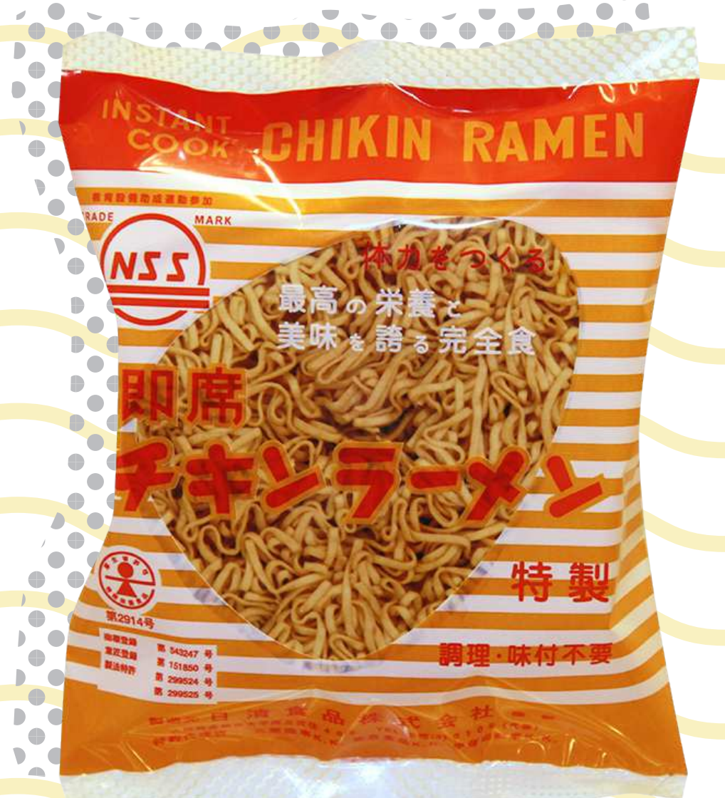
ชิกิน ราเม็ง (Chikin Ramen) ราเม็งรุ่นแรกของบริษัท

แต่การจะหาซามาใส่ราเม็งรับประทานก็ไม่ได้หาได้สะดวกทุกสถานการณ์ ในปี พ.ศ. 2514 (ค.ศ. 1971) จึงเกิดเป็นผลิตภัณฑ์ใหม่ “บะหมี่กึ่งสำเร็จรูปบรรจุในถ้วยพร้อมใช้งาน” โดยมีการใส่เนื้อสัตว์ ไข่ และผักปรุงรสสุกพร้อมรับประทาน ที่ผ่านการทำฟรีซดราย (Freeze dried)* ให้แห้งเพื่อถนอมอาหารมาเรียบร้อยแล้ว ทำให้ชาวญี่ปุ่นสามารถรับประทานราเม็งร้อน ๆ ได้ สะดวกสบายยิ่งขึ้น