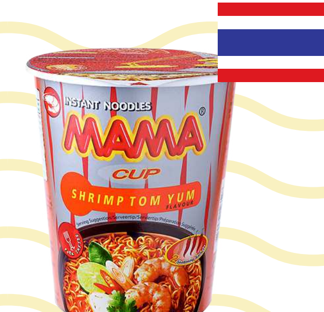
บะหมี่กึ่งสำเร็จรูป รสต้มยำกุ้ง (Tom Yam Kung)