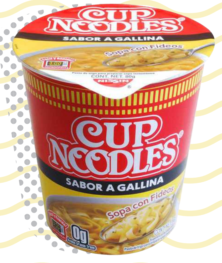
บะหมี่กึ่งสำเร็จรูปแบบถ้วย