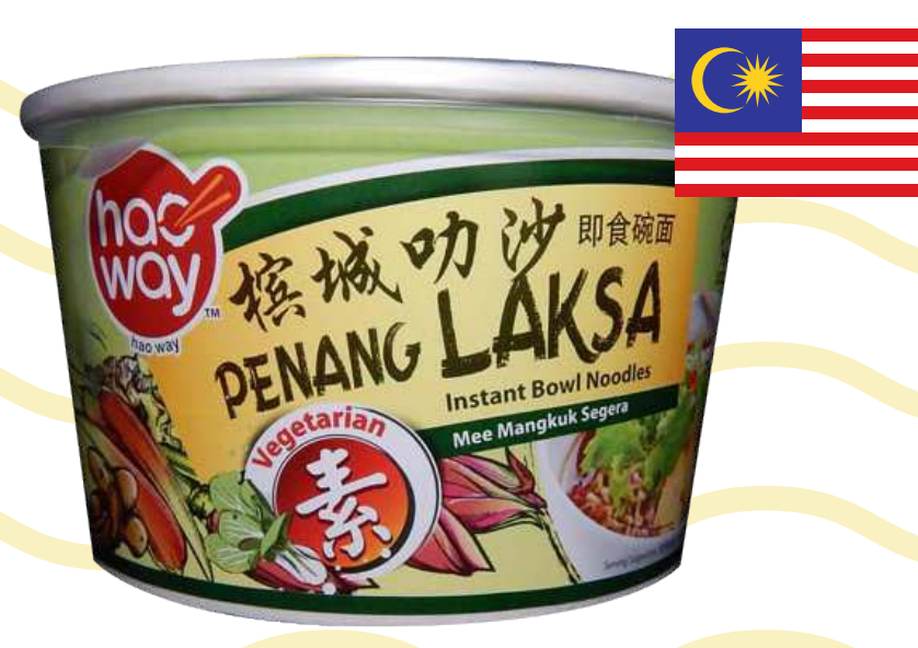
บะหมี่กึ่งสำเร็จรูป รสปีนังลักซา (Penang Laksa)