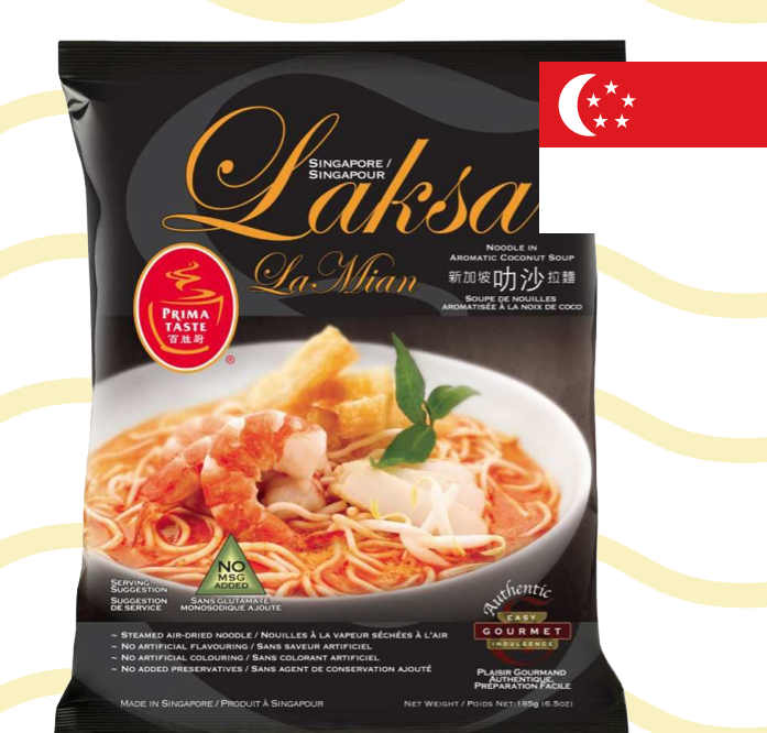
บะหมี่กึ่งสำเร็จรูป รสลักซา (Laksa)