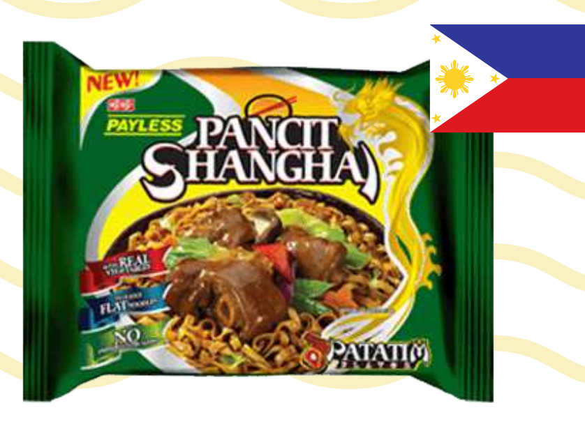
บะหมี่กึ่งสำเร็จรูป รสปาตาทิม (Patatim)