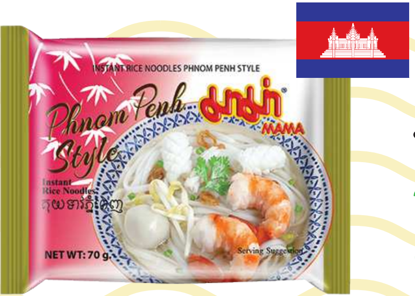
บะหมี่กึ่งสำเร็จรูป รสก้วยเตี้ยพนมเปญ (Phanom Penh)