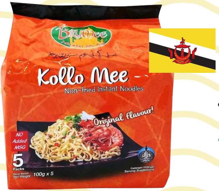
บะหมี่กึ่งสำเร็จรูป รสโคโลเหมี (Kollo Mee)