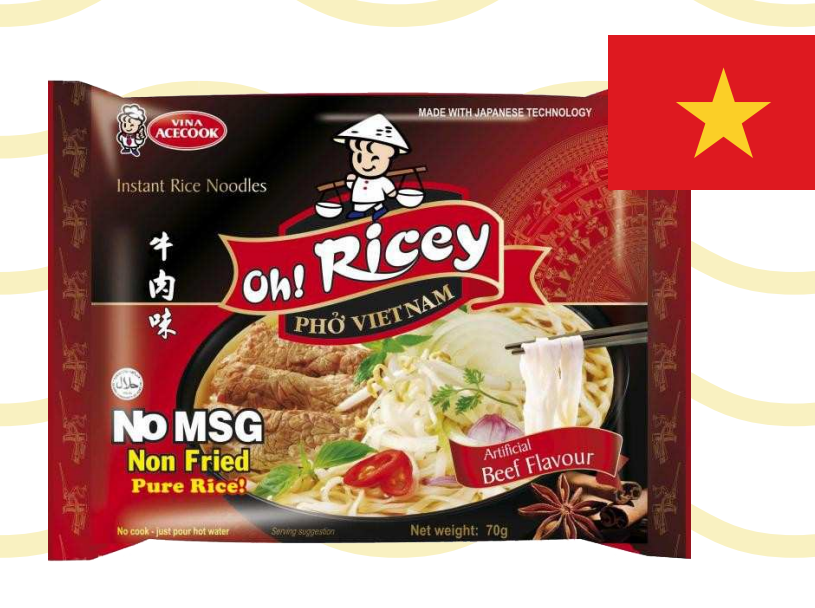
บะหมี่กึ่งสำเร็จรูป รสเฟอ (Pho)

*ฟรีซดราย (Freeze dried) คือ เทคโนโลยีการถนอมอาหารโดยดึงความชื้นออกด้วยความเย็นและแรงดันที่เหมาะสม เพื่อให้สามารถคงคุณค่าอาหารไว้ได้ถึงร้อยละ 98 และลดน้ำหนักลงเหลือเพียงร้อยละ 20 เท่านั้น เรียบเรียงข้อมูลจาก