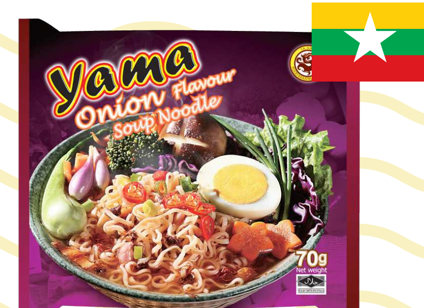
บะหมี่กึ่งสำเร็จรูป รสหอมเจียว (Fried Onion)