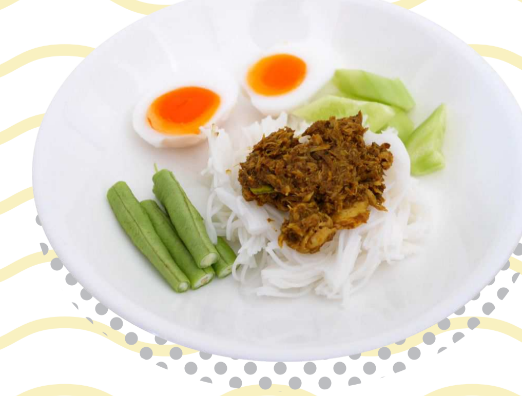
ภาคใต้ ปลา (ภาคใต้)

นิทรรศการ พิพิธอาเซียน ภาค 7 เส้นสำเรื่อง 08-60/No.07