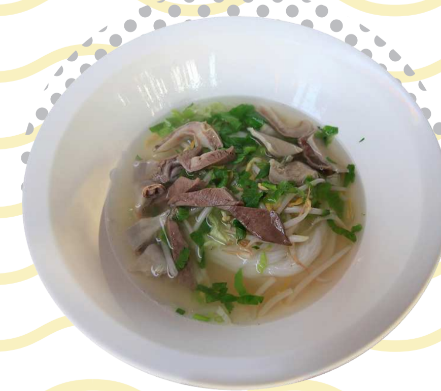
ภาคอีสาน น้ำแจ่ว