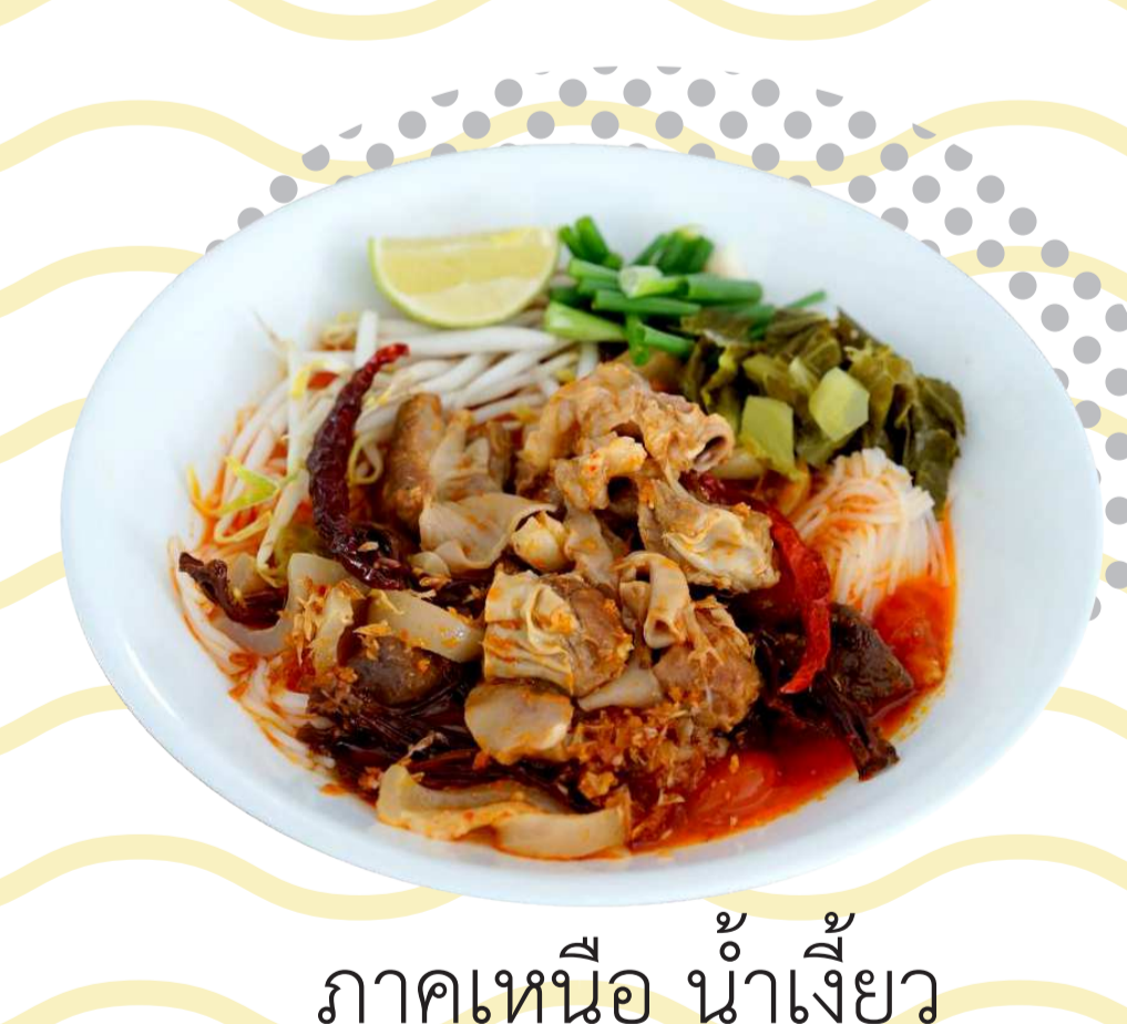
ภาคเหนือ น้ำเงี้ยว