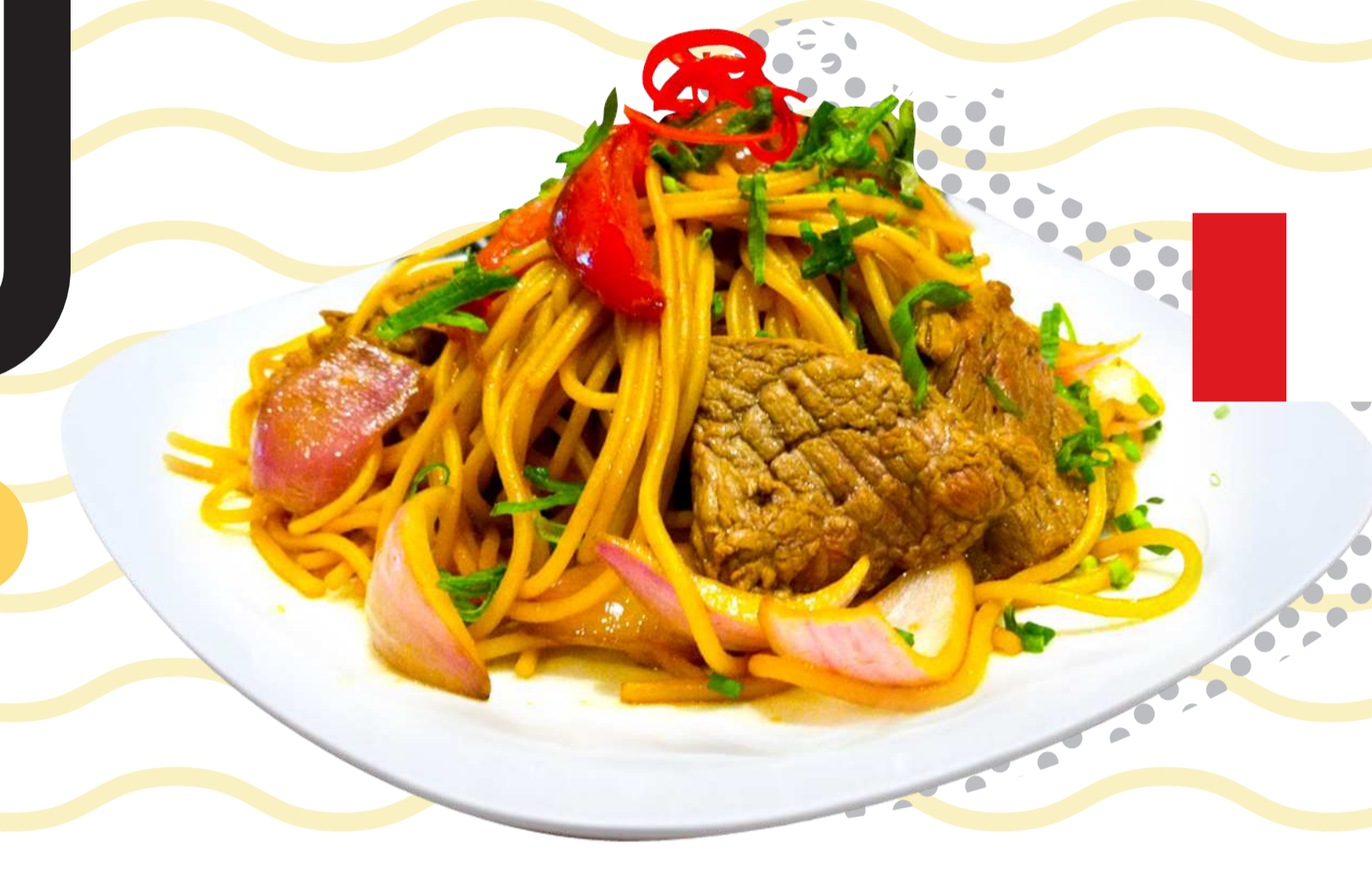
ผัดสปาเกตตีเปรู (Tallarin Saltado)

เมนูที่ได้รับอิทธิพลจากอาหารจีน แต่ใช้เส้นสโตนอิตาลีเลียนอย่าง “สปาเกตตี (Spaghetti)” หรือ “ลิงกวิเน (Linguine)” เป็นวัตถุดิบ นำมาผัดกับเนื้อสัตว์ต่าง ๆ ตามต้องการ และทำการคั่วบนกระทะไฟแรงตามวิธีผัดแบบจีน ส่วนผสมมักประกอบด้วยมะเขือเทศ หัวหอม กระเทียม ชิง และใส่ไวน์ขาวลงไปปรุงรสด้วยเกลือและพริกไทย ก่อนโรยหน้าด้วยต้นหอมหั่นท่อนและผักชีฝรั่งสับ เป็นเมนูที่สามารถหาได้ทั่วไปในท้องอาหารจีนกวางตุ้ง ซึ่งมีอยู่มากมายในกรุงลิมา เมืองหลวงของประเทศเปรู