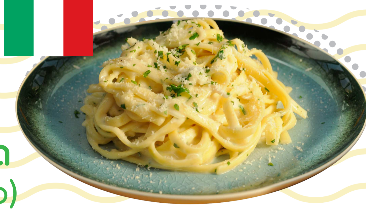
เฟตตูชิน อัลเฟรโด (Fettuccine alfredo)

เป็นอีกเมนูซึ่งเป็นที่นิยมของชาวอิตาลีเลียน ใช้ “ซอสครีม” ที่เรียกว่า “ซอสอัลเฟรโด (Alfredo)” ซึ่งเป็นซอสที่ผสมครีมและชีสพาร์เมซาน (Parmesan) เข้าด้วยกัน โดยใช้วิธีการทำซอสให้เสร็จ ก่อนนำมาผัดรวมกับเส้น “เฟตตูชิน (Fettuccine)” ที่ทำการต้มสุกแล้ว อาจเพิ่มเนื้อสัตว์หรือเห็ดแชมปิญองลงไปผัดรวมด้วยตามชอบ หรือเพิ่มชีสพาร์เมซานตอนร้อนๆ ได้เลย