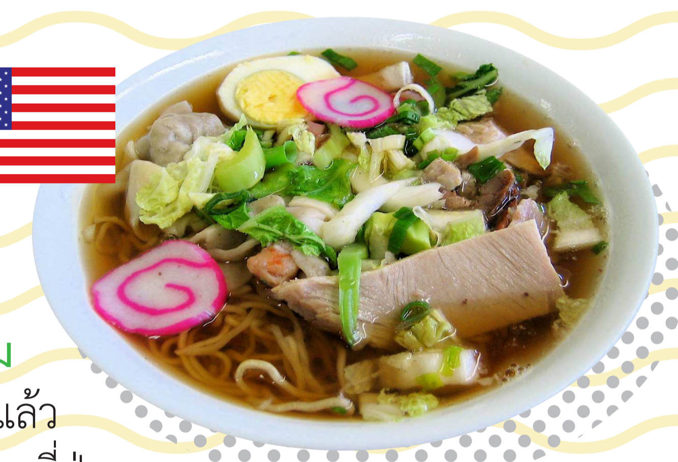
ก๋วยเตี๋ยวน้ำฮาวาย (Saimin)

เมนูบะหมี่ใส่น้ำซุปลิสต์สไตล์ญี่ปุ่น มีลักษณะผสมระหว่างราเม็งสไตล์ญี่ปุ่นกับบะหมี่ของจีน แท้จริงแล้ว Saimin เป็นอาหารที่ได้รับอิทธิพลมาจากผู้อพยพชาวญี่ปุ่น และจีนที่ลี้ภัยมาอยู่รัฐฮาวาย ประเทศสหรัฐอเมริกาในช่วงปี ค.ศ. 1800 (พ.ศ. 2343) แต่ได้รับการพัฒนารสชาติให้มีเอกลักษณ์เฉพาะ ถูกปากทั้งคนท้องถิ่นและนักท่องเที่ยว เมนูนี้ได้รับความนิยมถึงขนาดที่ร้านเบอร์เกอร์แฟรนไชส์ชื่อดังอย่างแมคโดนัลด์ที่ฮาวาย ต้องมีเมนูนี้ไว้ให้บริการ