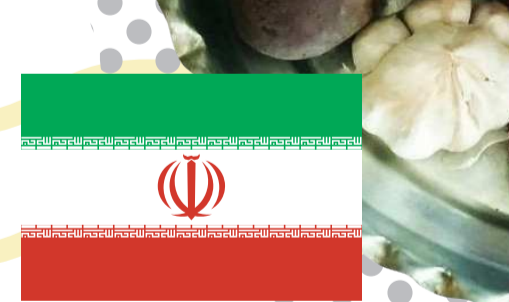
บะหมี่เปอร์เซีย (Ash Reshteh)

ใช้เส้นที่เรียกว่า “เรซเทห์ (Reshteh)” รับประทานในน้ำซุบบางม้งสีวรรตีมีลักษณะเป็นซุบขุ่น เรียกว่า “มินเนสโตรเน่ (Minestrone)” ที่ประกอบด้วย พืชผักสมุนไพรที่ติดรสสุขภาพ เช่น ขมิ้น ผักขม และถั่วลิสง รวมถึงเครื่องเทศที่ไวกลิ่น เช่น สะระแหน่ หอม กระเทียม โรยหน้าด้วยผักชีฝรั่ง ชาวอิหร่านเชื่อกันว่าอาหารจานนี้จะทำให้เกิดโชคลาภ และความสำเร็จ จึงเป็นอีกหนึ่งเมนูที่ชาวอิหร่านนิยมรับประทานในช่วงเทศกาลปีใหม่ของพวกเขาที่เรียกว่า “โนรูซ (Norooz)”