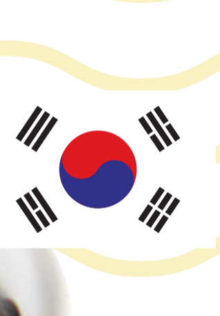
จางจ็องมยอน (Chajangmyeon)

บะหมี่ดำเกาหลีใต้ที่คนไทยเรียกกันติดปากว่า “จางจ็องมยอน” จริง ๆ แล้วไม่ใช่อาหารของเกาหลี แต่เป็นอาหารทางตอนเหนือของชาวจีน ซึ่งเป็นอาหารที่ได้รับความนิยมเป็นอย่างมากในเกาหลี โดยรับประทานกับซอสถั่วดำเข้มข้นที่เรียกว่า “จางจ็อง” คู่กับแตงกวาทันเป็นเส้นแซ่เย็นเพิ่มความสดชื่นและแก้เลี่ยนได้เป็นอย่างดี