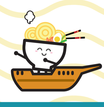
เส้นทางสายไหมทางทะเล