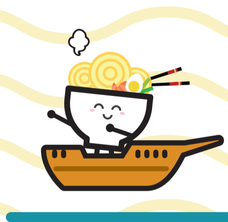
เส้นทางสายไหมทางทะเล