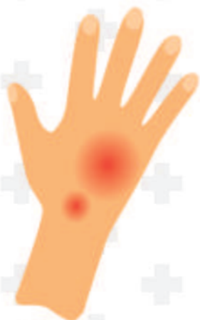
ระดับที่ 1

การที่ผิวหนังหรือเนื้อเยื่อใต้ผิวหนังถูกทำลาย แบ่งออกได้เป็น 3 ระดับ ขึ้นอยู่กับความลึก และความกว้างของแผล ได้แก่