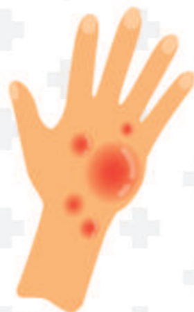
ระดับที่ 2

เป็นการไหม้บริเวณผิวหนังด้านนอก เห็นเป็นรอยแดงที่ผิวหนัง