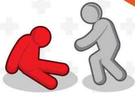
หมดสติ ช็อก สะลึมสะลือ เรียกไม่รู้สีกตัว

อาการเจ็บป่วยมีหลายระดับ อาการเจ็บป่วยทั่วไปที่สามารถดูแลตัวเองได้ ไปจนถึงระดับอาการเจ็บป่วยฉุกเฉินที่เกิดจากการได้รับบาดเจ็บ หรืออาการป่วยที่เป็นอันตรายต่อการดำรงชีวิตหรือการทำงานของอวัยวะสำคัญ จำเป็นต้องได้รับการประเมินและบำบัดรักษาอย่างทันท่วงที เพื่อป้องกันไม่ให้อาการรุนแรงของการบาดเจ็บเพิ่มขึ้น หรือเกิดการเสียชีวิต