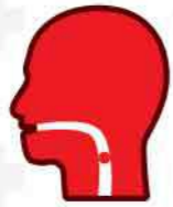
มีสิ่งแปลกปลอมอุดตัน ทางเดินหายใจ