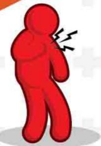
เจ็บหน้าอก หายใจหอบเหนื่อย