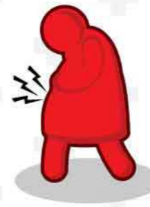
เจ็บท้องคลอต คลอตฉุกเฉิน