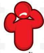
ปากเบี้ยว อ่อนแรงครึ่งซีกฉับพลัน