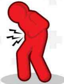
ปวดท้องรุนแรง