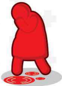
ตกเลือด เลือดออกทางช่องคลอด