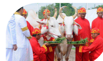
พิธีจรดพระนังคัลแรกนาขวัญ

ในทางศาสนาพราหมณ์ “พระโค” ถือเป็นเทวดาผู้ทำหน้าที่เป็นพาหนะของพระอิศวร แสดงให้เห็นถึงความสามารถทั้งในด้านของการใช้แรงงานและความเข้มแข็ง นอกจากนี้ยังเป็นสัตว์เลี้ยง ที่พระกฤษณะและพระพลเทพดูแลซึ่งเปรียบได้ถึงความอุดมสมบูรณ์ ดังนั้นในการประกอบพระราชพิธีจรดพระนังคัลแรกนาขวัญ จึงได้กำหนดให้มีพระโคเพศผู้เข้าร่วมพิธีเสมอมาตั้งแต่รัชกาลที่ 1 เพื่อเป็น “ตัวแทนของความเข้มแข็งและความอุดมสมบูรณ์”