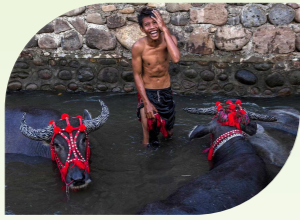
ควายปลัก (Swamp Buffalo) ควายแม่น้ำ (River Buffalo)

“ควายกับการทำนา” ควายขึ้นชื่อการนอนแช่โคลน หรือนอนแช่น้ำเมื่ออากาศร้อน กลุ่มสายพันธุ์หลักที่นิยมนำมาใช้แรงงาน เป็น “ควายปลัก (Swamp Buffalo)” หรือ “ควายแม่น้ำ (River Buffalo)” ซึ่งได้รับความนิยมในการเลี้ยงเพื่อการ “ทำนาในพื้นที่ลุ่มน้ำ”