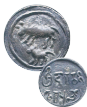
เหรียญสมัยทวารวดี ราวพุทธศตวรรษที่ 12

ประเพณีแข่งชิงควาย (Water Buffalo Chariot Races) บนท้องนา เพื่อเฉลิมฉลองฤดูกาลเพาะปลูกข้าวประจำปี ผู้ขับจะยืนบนโครงไม้รูปแบบเฉพาะตัวที่เทียมโดยควายสองตัว ความสนุกสุดมันคือผู้ขับจะต้องรักษามุดในการทรงตัว ซึ่งควายทั้ง 2 จะพัวรั้งด้วยความเร็วกว่า 30 ไมล์ต่อชั่วโมง