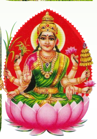
พระธัญญลักษมี (Dhanya Lakshmi)