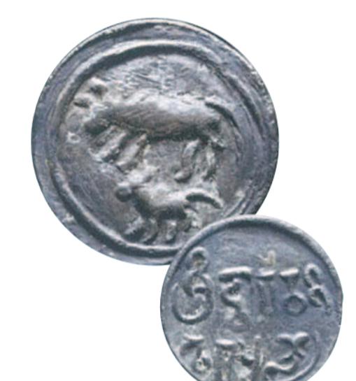
เหรียญสมัยทวารวดี ราวพุทธศตวรรษที่ 12

ประเพณีแข่งชิงควาย (Water Buffalo Chariot Races) บนท้องนา เพื่อเฉลิมฉลองฤดูกาลเพาะปลูกข้าวประจำปี ผู้ขับจะยืนบนโครงไม้ รูปแบบเฉพาะตัวที่เทียมโดยควายสองตัว ความสนุกสนานคือผู้ขับจะต้องรักษาสถิตในการทรงตัว ซึ่งควายทั้ง 2 จะพาวิ่งด้วยความเร็วกว่า 30 ไมล์ต่อชั่วโมง