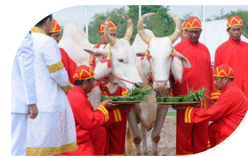
พิธีจรดพระนังคัลแรกนาขวัญ

ในทางศาสนาพราหมณ์ “พระโค” ถือเป็นเทวดาผู้ทำหน้าที่เป็นพาหนะของพระอิศวร แสดงให้เห็นถึงความสามารถทั้งในด้านของการใช้แรงงานและความเข้มแข็ง นอกจากนี้ยังเป็นสัตว์เลี้ยงที่พระกฤษณะและพระพลเทพดูแล ซึ่งเปรียบได้ถึงความอุดมสมบูรณ์ ดังนั้นในการประกอบพระราชพิธีจรดพระนังคัลแรกนาขวัญ จึงได้กำหนดให้มีพระโคเพศผู้เข้าร่วมพิธีเสมอมาตั้งแต่รัชกาลที่ 1 เพื่อเป็น “ตัวแทนของความเข้มแข็งและความอุดมสมบูรณ์”