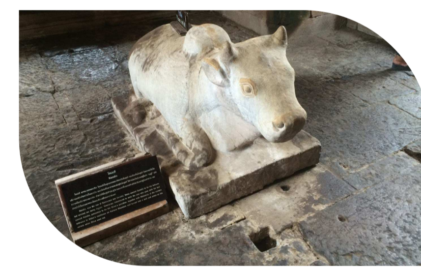
โคนนทิ ปราสาทหินพนมรุ้ง จังหวัดบุรีรัมย์

ด้วยความเจริญก้าวหน้าของเทคโนโลยีอย่างรวดเร็ว “มิตรแท้คู่ใจและเครื่องใช้คู่กายของชาวนา” จึงค่อย ๆ ผันสู่เครื่องยนต์กลไก ซึ่งสามารถทำงานได้เร็วกว่าเดิมมาก อย่างไรก็ตามภาพของ “โค - กระบือ” ในท้องทุ่ง ก็ยังคงเป็นภาพที่ปรากฏให้เห็นอยู่ได้บ้างและเป็นภาพในความทรงจำอันงดงามของชาวอาเซียน