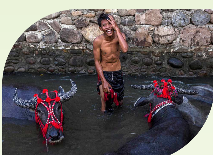
ควายแม่น้ำ (River Buffalo)

“ควายกับการทำนา” ควายขึ้นชอบการนอนแช่โคลน หรือนอนแช่น้ำเมื่ออากาศร้อน กลุ่มสายพันธุ์หลักที่นิยมนำมาใช้แรงงาน เป็น “ควายปลัก (Swamp Buffalo)” หรือ “ควายแม่น้ำ (River Buffalo)” ซึ่งได้รับความนิยมในการเลี้ยงเพื่อการ “ทำนาในพื้นที่ลุ่มน้ำ”