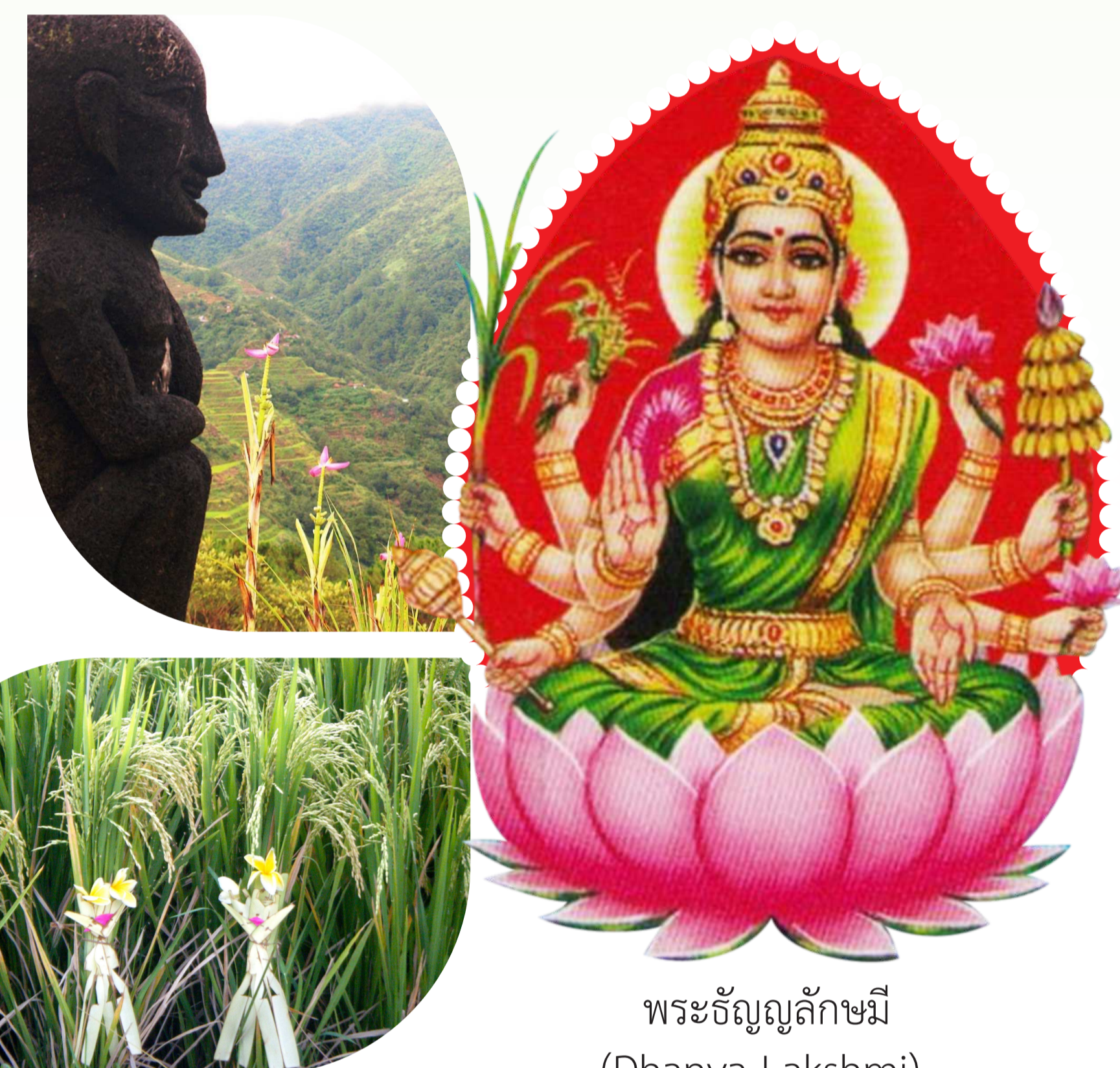
พระธัญญลักษมี (Dhanya Lakshmi)