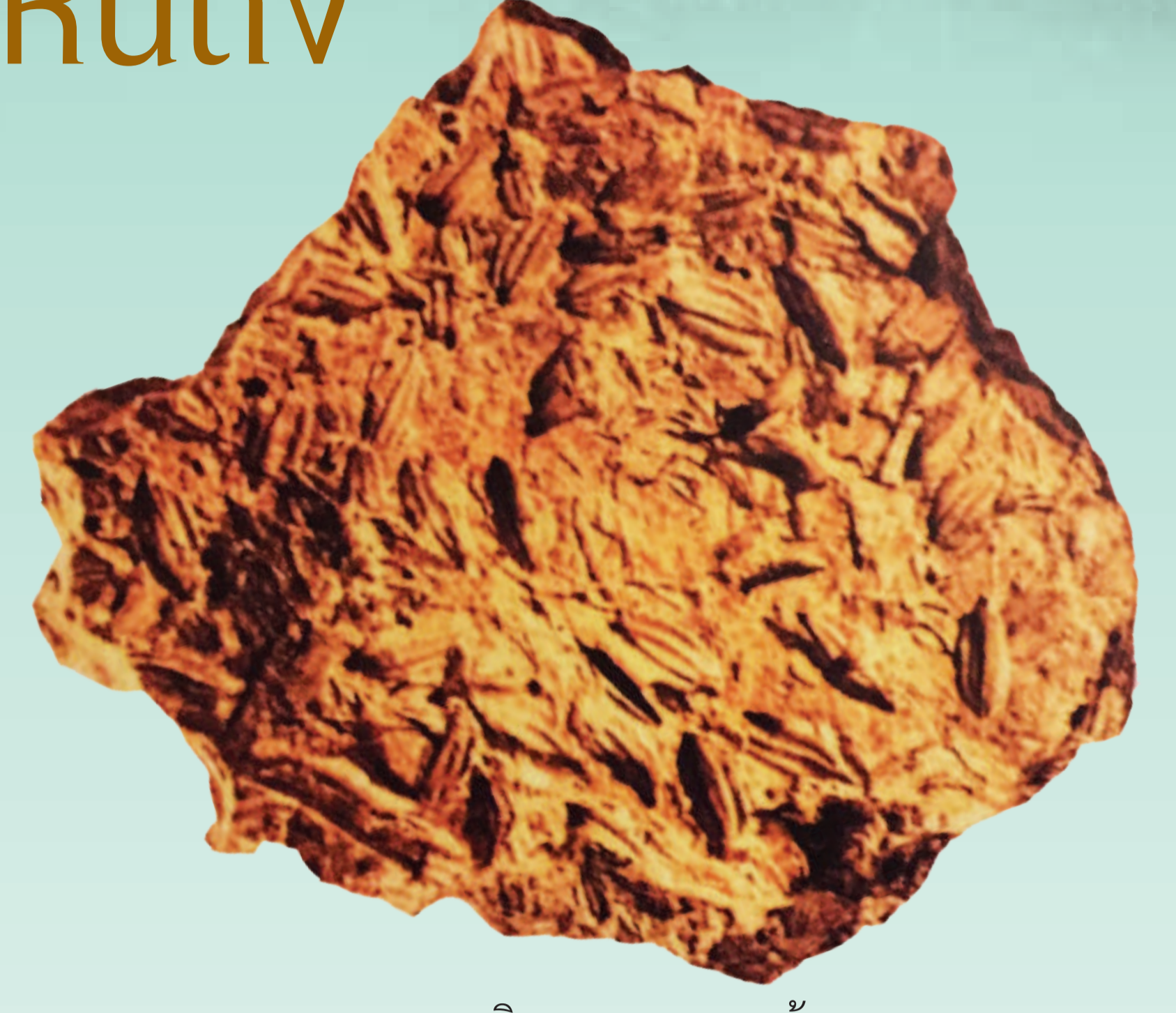
เศษภาชนะดินเผาผสมเมล็ดข้าว อายุราว 3,000 ปี พบในประเทศไทย

ต้นข้าวกำเนิดขึ้นมาบนโลกนี้นับล้านปี ก่อนที่มนุษย์ จะเกิดขึ้นมาเสียอีก เมล็ดข้าวที่คนนำมากินช่วงแรกนั้นเป็นต้นข้าวป่า หรือข้าวที่เกิดขึ้นเอง ไม่ใช่ต้นข้าวที่คนปลูก