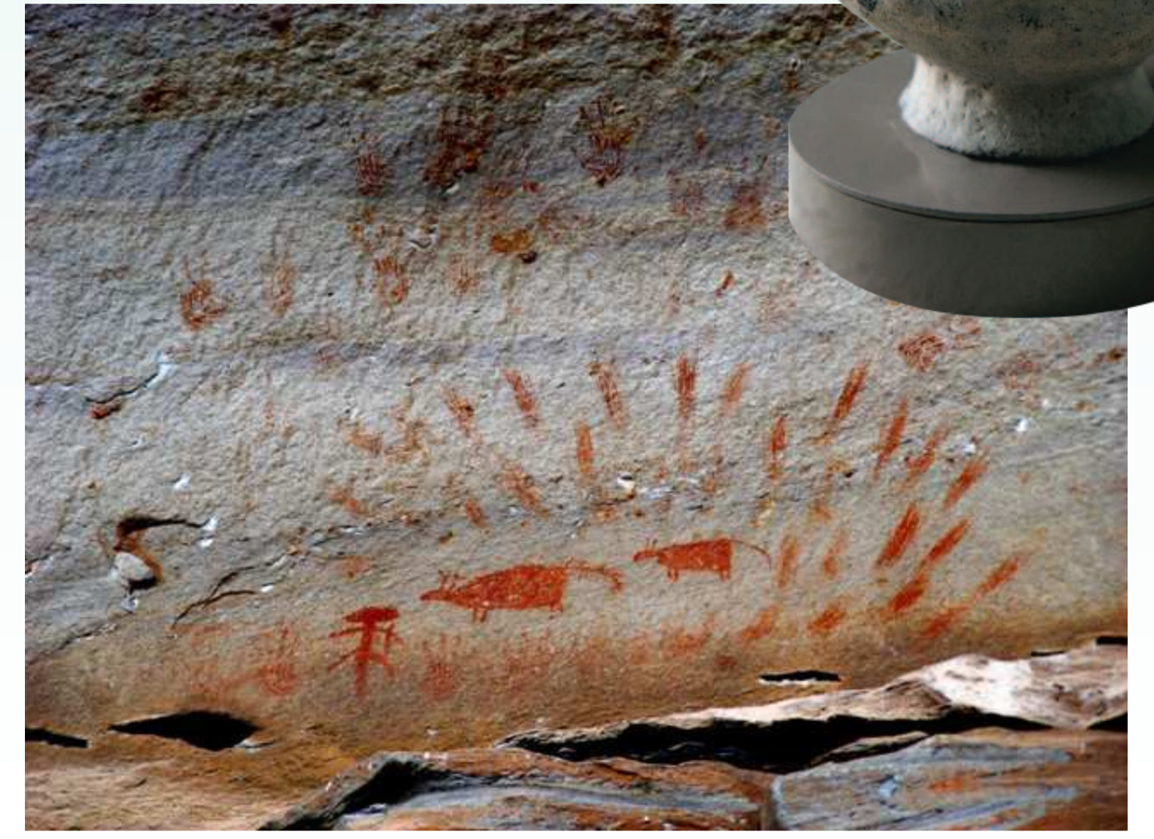
ภาพเขียนสีผาหมอน อุทยานแห่งชาติผาแต้ม จ.อุบลราชธานี