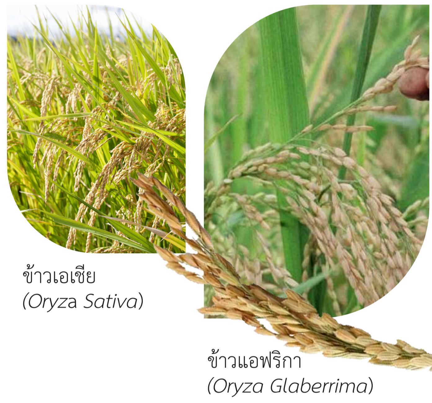
ข้าวเอเชีย (Oryza Sativa)