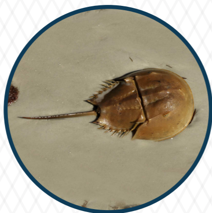
แมงดาทะเล Horseshoe crab 445 ล้านปี