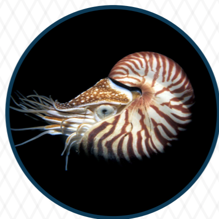
หอยวงช้าง Nautilus 500 ล้านปี