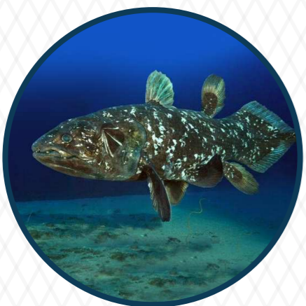
ปลาซีลาแคนท์ Coelacanth 360 ล้านปี