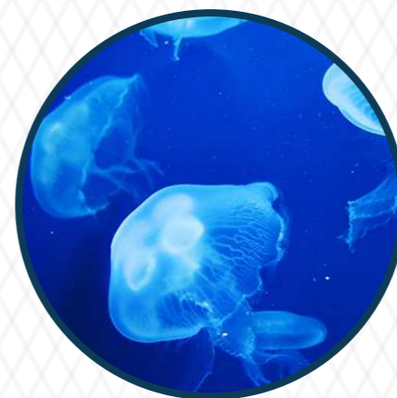
แมงกะพรุน Jellyfish 550 ล้านปี