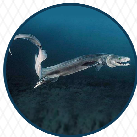
ฉลามฟริลด์ Frilled shark 150 ล้านปี