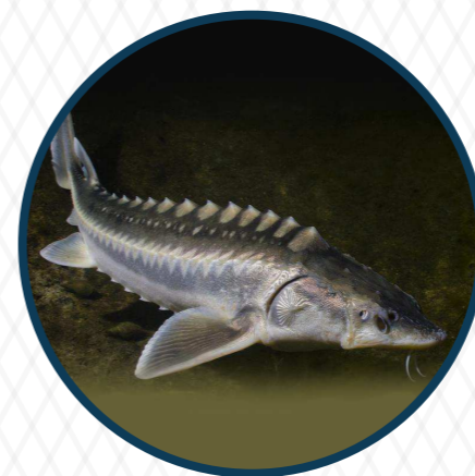
ปลาสเตอร์เจียน Sturgeon 200 ล้านปี