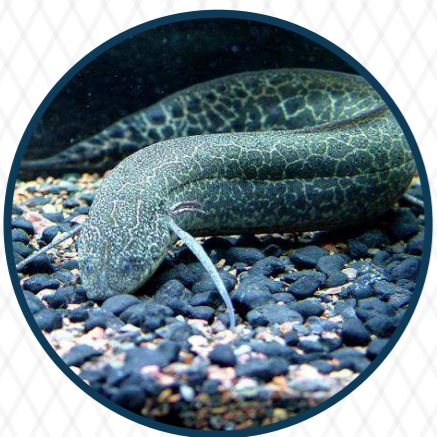
ปลาปอด Lung Fish 100 ล้านปี