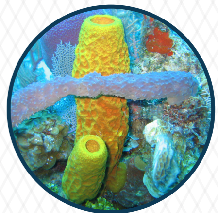
ฟองน้ำ Marine sponges 580 ล้านปี