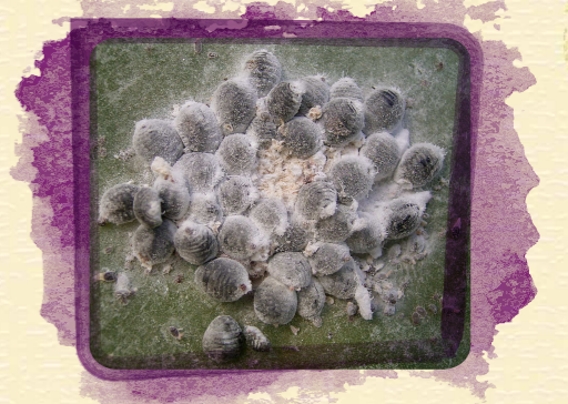
เปลือกหอย Cochineal

ที่หมู่เกาะคานารี (Canary Islands) ยังคงมีการผลิตสีย้อมจากธรรมชาติที่เป็น สีแดงเข้ม หรือที่คนไทยรู้จักในนาม “สีแดงชาด” จากเปลือกหอย Cochineal แมลงชนิดหนึ่งที่กินต้นเสมาเป็นอาหาร ซึ่งสร้างรายได้จำนวนมากให้แก่หมู่เกาะแห่งนี้