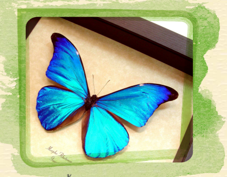
ผีเสื้อ Morpho rhetenor

สีของสัตว์และพืชส่วนใหญ่เกิดจากรังควัตถุ (Pigment) แต่ สีฟ้าที่ปักของผีเสื้อ Morpho rhetenor เกิดจากแสงที่สะท้อนจากเกล็ดที่ไม่มีสีบนปีกที่ขรุขระของมัน