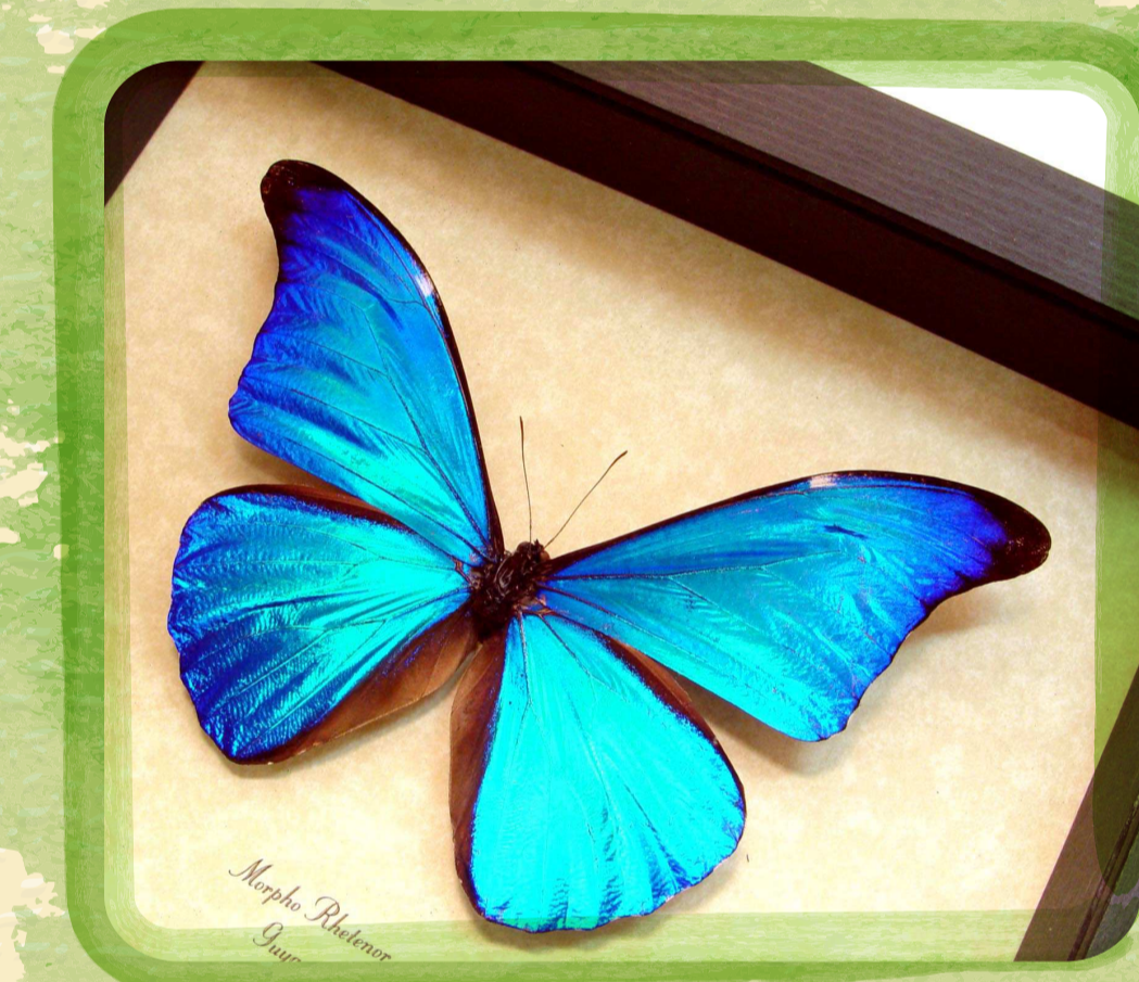
ผีเสื้อ Morpho rhetenor

สีของสัตว์และพืชส่วนใหญ่เกิดจากรังสี ควัตถุ (Pigment) แต่ สีฟ้าที่ปีกของผีเสื้อ Morpho rhetenor เกิดจากแสงที่สะท้อนจากเกล็ดที่ไม่มีสีบนปีกที่ขรุขระของมัน