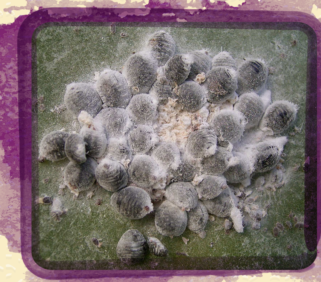
เพลี้ยหอย Cochineal

ที่หมู่เกาะคานารี (Canary Islands) ยังคงมีการ ผลิตสีย้อมจากธรรมชาติที่เป็นสีแดงเข้ม หรือที่คนไทยรู้จักในนาม “สีแดงชาด” จากเพลี้ยหอย Cochineal ซึ่งเป็นแมลงชนิดหนึ่งที่กินต้นเสมาเป็นอาหาร ซึ่งสร้างรายได้จำนวนมากให้แก่หมู่เกาะแห่งนี้