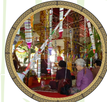
พิธีสืบชะตา

นอกจากนี้ยังมีการนำ " ไผ่บง " มาใช้เป็นส่วนประกอบหลักในพิธีกรรมความเชื่อเกี่ยวกับขวัญและดวงชะตา คือ " พิธีสืบชะตา " ซึ่งเป็นพิธีต่ออายุให้มีความสุขความเจริญ