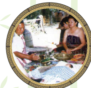
ทำขวัญเด็กทารก

คนเผ่าคนแก่ยังนำเด็กแรกเกิดใส่ กระดุงไม้ไผ่ แล้วร่อนเบา ๆ พร้อมกับพูดว่า " สามวันลูกผี สี่วันลูกคน ลูกของใคร ใครเอาไปน้อ " ผู้หญิงที่อยู่ในพิธีเข้ามารับซื้อเด็กไว้โดยให้เงินกับผู้ทำพิธีพอเป็นพิธี เพราะเราเชื่อว่าการที่เด็กถือกำเนิดมาในครรภ์มารดานั้นจะมีผีหรือแม่ชื้อเป็นคนปั้นหุ่นขึ้นมา แล้วนำวิญญาณมาใส่แล้วจึงส่งมาเกิด และจะตามมาดูแลเด็กด้วยความรัก หรือเป็นวิญญาณร้ายมาเอาชีวิตเด็ก ดังนั้นจึงทำพิธีนี้ขึ้นเพื่อหลอกล่อผีหรือแม่ชื้อไม่ให้มารบกวน หรือมาเอาชีวิตของเด็กทารก