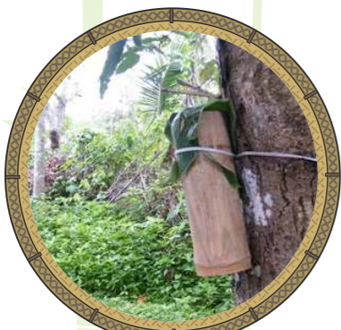
กระบอกใส่สายสะดือเด็ก

บ้านของคนไทยสมัยก่อนนิยมสร้างบ้านแบบเรือนเครื่องผูก ที่นำลำไผ่ขนาดต่าง ๆ มาเป็นส่วนประกอบหลักในการสร้างบ้าน เช่น พื้นบ้าน นิยมบุด้วย กระบอกไม้ไผ่ ที่นำมาทุบข้อให้แตกแล้วแผ่ออกตามความยาวได้เป็นแผ่นกระดาน เรียกว่า " พาก " ดังนั้นเวลาที่เด็กคลอตอกกมาถึงพื้นบ้านจึงเรียกว่า " เวลาตอกพาก " มีการนำ ผิวไม้ไผ่ ที่เกลารจนคมผ่านการลนไฟมาตัดสายสะดือเด็กแรกเกิด แล้วนำสายสะดือใส่ กระบอกไม้ไผ่ ไปแขวนตามต้นไม้ในป่า และนำต้นไม้ที่มีหนามอย่าง ไม้มา้ว ที่ได้ถูบ้านในช่วงระหว่างคลอด เพราะคนชนบทเชื่อว่าจะป้องกันผีกระสือที่จะเข้ามากินตับไตไส้พุงของทั้งแม่และลูก