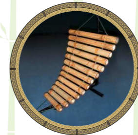
โปงลางไผ่ไผ่

“ขลุ่ยเสียงนก” เป็นขลุ่ยชนิดหนึ่งที่มีแกนไม้เป็นคันชักตรงปลายตั้งเข้าออกได้ เพื่อเปลี่ยนเสียง เมื่อชักเข้าออกจะมีเสียงคล้ายนกนิยมทำด้วย “ไผ่ซาง”