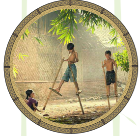
ชาโลกเทก

เป็นของเล่นที่สามารถลอยขึ้นฟ้าได้ โดยเกิดจากการผสมผสานระหว่างของเล่น 2 ชิ้น คือ กำหมูนและจวนบิน โดย กำหมูน นิยมทำมาจาก “ไผ่เอี้ยะ”