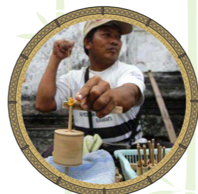
มะข่างไว้

ลูกข่างชนิดหนึ่งที่ทำมาจาก “ไผ่เอี้ยะ” หรือ “ไผ่รวก” ประกอบด้วยมะข่าง เชือก ต้มไม้ไผ่เจาะรู จะพันเชือกที่แกนแล้วคว้างลงพื้นให้หมุน เมื่อไม้หมุนแรงตันลมจะทำให้เกิดเสียงไว้ ๆ