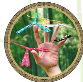
แมลงปอเกาะนิ้ว

ลูกข่างชนิดหนึ่งที่ทำมาจาก “ไผ่เอี้ยะ” หรือ “ไผ่รวก” ประกอบด้วยมะข่าง เชือก ต้มไม้ไผ่เจาะรู จะพันเชือกที่แกนแล้วคว้างลงพื้นให้หมุน เมื่อไม้หมุนแรงตันลมจะทำให้เกิดเสียงไว้ ๆ