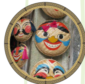
หน้ากากเวียดคนาม

เป็นชื่อของเล่นที่ทำมาจาก “ไผ่เอี้ยะ” หรือ “ไผ่ซาง” โดยตั้งชื่อมาจากนักยิมนาสติกชื่อดังคือ “อมรเทพ แวแสลง” มีวิธีการเล่นโดยบีบแกนไม้ไผ่โค้งรูปตัวเข้าหากันแล้วปล่อยออกให้กลับอยู่สภาพเดิม