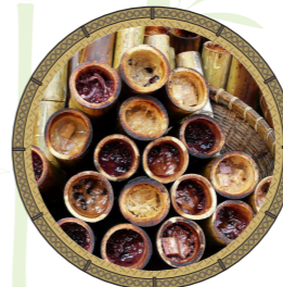
ข้าวหลาม