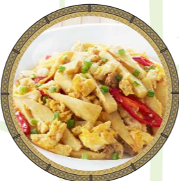
หน่อไม้ผัดไข่