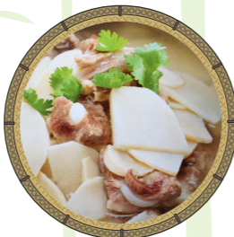
ต้มจืดหน่อไม้กระดุกหมู