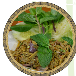
ซุปร้อนไม้

เป็นส่วนหนึ่งของไผ่ที่มนุษย์รู้จักกันดี สามารถนำมาประกอบอาหารบริโภคได้มากมาย ตัวอย่างเมนูอาหารรสเลิศที่ปรุงจากหน่อไม้