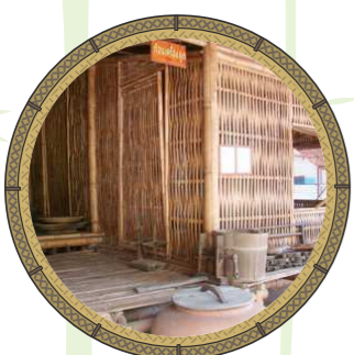
พื้นบ้าน “ฟาก”