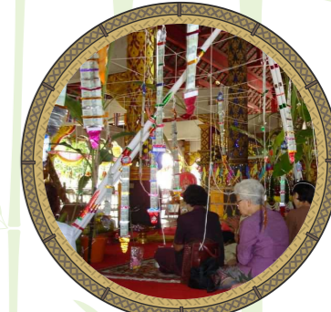
พิธีสืบชะตา

นอกจากนี้ยังมีการนำ “ ไผ่บง ” มาใช้เป็นส่วนประกอบหลักในพิธีกรรมความเชื่อเกี่ยวกับขวัญและดวงชะตา คือ “ พิธีสืบชะตา ” ซึ่งเป็นพิธีต่ออายุ ให้มีความสุขความเจริญ