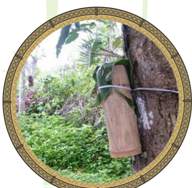
กระบอกใส่สายสะดือเด็ก

บ้านของคนไทยสมัยก่อนนิยมสร้างบ้านแบบเรือนเครื่องผูก ที่นำลำไผ่ขนาดต่าง ๆ มาเป็นส่วนประกอบหลักในการสร้างบ้าน เช่น พื้นบ้าน นิยมบุด้วย กระบอกไม้ไผ่ ที่นำมาทุบข้อให้แตกแล้วแผ่ออกตามความยาวได้เป็นแผ่นกระดาน เรียกว่า “ ฟาก ” ดังนั้นเวลาที่เด็กคลอตออกมา ถึงพื้นบ้านจึงเรียกว่า “ เวลาตกฟาก ” มีการนำ ผิวไม้ไผ่ ที่เกลารจนคมผ่านการลนไฟมาตัดสายสะดือเด็กแรกเกิด แล้วนำสายสะดือใส่ กระบอกไม้ไผ่ ไปแขวนตามต้นไม้ในป่า และนำต้นไม้ที่มีหนามอย่าง ไผ่มาไว้ ที่ใต้ถุนบ้านในช่วงระหว่างคลอด เพราะคนชนบทเชื่อว่าจะป้องกันผีกระสือที่จะเข้ามา กินตับไตไส้พุงของทั้งแม่และลูก