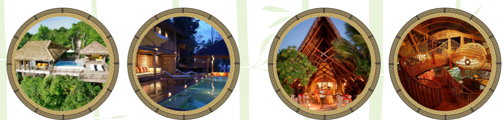
โรงแรม เดอะซิกเนลส์ เกะยาวน้อย

บริษัทออกแบบสถาปัตยกรรมจากไม้ไฟและไม้ไฟเพื่อการส่งออก มีบริการดูแลรักษาไม้ไฟด้วยการเคลือบ (Bamboo Treatment) เพื่อป้องกันมอดและแมลงเข้าไปทำลายไม้ไฟ ทำให้ไม้ไฟทนทานและยืดอายุการใช้งานให้นานยิ่งขึ้น