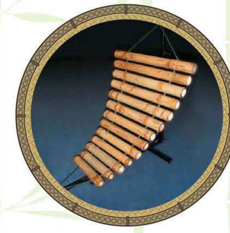
โปงลางไผ่ไผ่

“ปี่เสียงนก” เป็นปี่ชนิดหนึ่งที่มีแกนไม้เป็นคันชักตรงปลาย ดึงเข้าออกได้เพื่อเปลี่ยนเสียง เมื่อชักเข้าออก จะมีเสียงคล้ายนกนิยมนำทำด้วย “ไผ่ซาง”