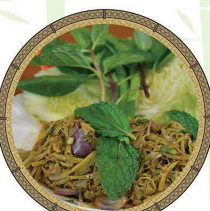
ซุปรน่อไม้

หน่อไม้ เป็นส่วนหนึ่งของไผ่ ที่มนุษย์รู้จักกันดี สามารถนำมาประกอบอาหารบริโภคได้มากมาย ตัวอย่างเมนูอาหารรสเลิศที่ปรุงจากหน่อไม้