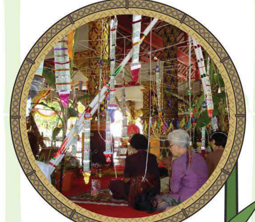
พิธีสืบชะตา

นอกจากนี้ยังมีการนำ “ไผ่บง” มาใช้เป็นส่วนประกอบหลักในพิธีกรรมความเชื่อเกี่ยวกับขวัญและดวงชะตา คือ “พิธีสืบชะตา” ซึ่งเป็นพิธีต่ออายุให้มีความสุขความเจริญ