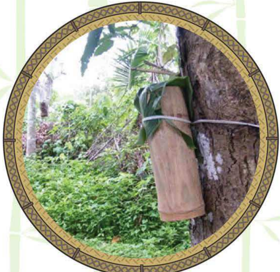
กระบอกใส่สายสะดือเด็ก

บ้านของคนไทยสมัยก่อนนิยมสร้างบ้านแบบเรือนเครื่องผูก ที่นำลำไผ่ขนาดต่าง ๆ มาเป็นส่วนประกอบหลักในการสร้างบ้าน เช่น พื้นบ้านนิยมปูด้วยกระบอกไม้ไผ่ที่นำมาทุบซ้อให้แตกแล้วแผ่ออกตามความยาวได้เป็นแผ่นกระดาน เรียกว่า “ฟาก” ดังนั้นเวลาที่เด็กคลอตออกมาถึงพื้นบ้านจึงเรียกว่า “เวลาตกฟาก” มีการนำไม้ไผ่ที่เกลี้ยงจนคมผ่านการลนไฟมาตัดสายสะดือเด็กแรกเกิด แล้วนำสายสะดือใส่กระบอกไม้ไผ่ไปแขวนตามต้นไม้ในป่า และนำต้นไม้ที่มีหนามอย่างไผ่มาไว้ที่ใต้ถุนบ้านในช่วงระหว่างคลอต เพราะคนชนบทเชื่อว่า จะป้องกันผีกระสือที่จะเข้ามากินตับไตไส้พุงของทั้งแม่และลูก