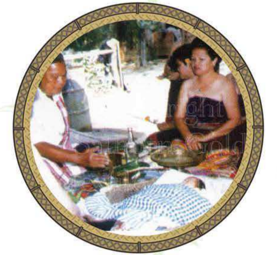
ทำขวัญเด็กทารก

คนแต่มาคนแก่อยังนำเด็กแรกเกิดใส่ กระดิ่งไม้ไผ่ แล้วร้อนเบา ๆ พร้อมกับพูดว่า “สามวันลูกมีสี่วันลูกคน ลูกของใคร ใครเอาไปเน้อ” ผู้หญิงที่อยู่ในพิธีเข้ามารับซื้อเด็กไว้โดยให้เงินกับผู้ที่ทำพิธีพอเป็นพิธี เพราะเราเชื่อว่าการที่เด็กถือกำเนิดมาในครรภ์มารดานั้นจะมีผีหรือแม่ชื้อเป็นคนปั้นหุ่นขึ้นมาแล้วนำวิญญาณมาใส่แล้วจึงส่งมาเกิด และจะตามมาดูแลเด็กด้วยความรักหรือเป็นวิญญาณร้ายมาเอาชีวิตเด็ก ดังนั้นจึงทำพิธีนี้ขึ้นเพื่อหลอกล่อผีหรือแม่ชื้อ ไม่ให้มารบกวนหรือมาเอาชีวิตของเด็กทารก