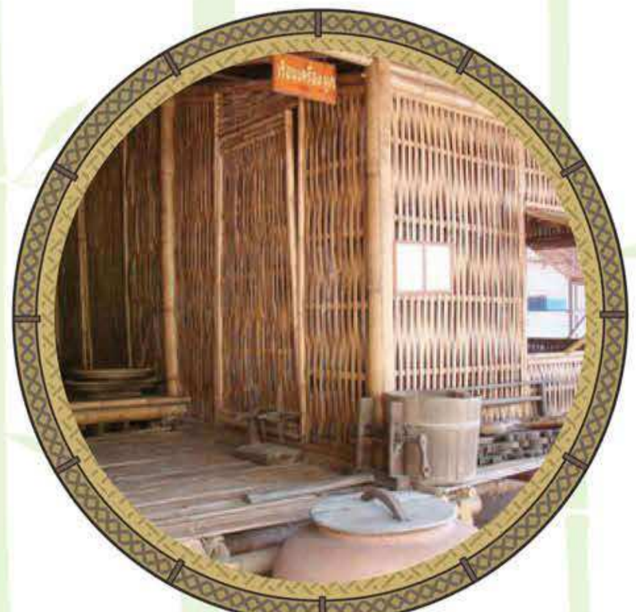
พื้นบ้าน “ฟาก”