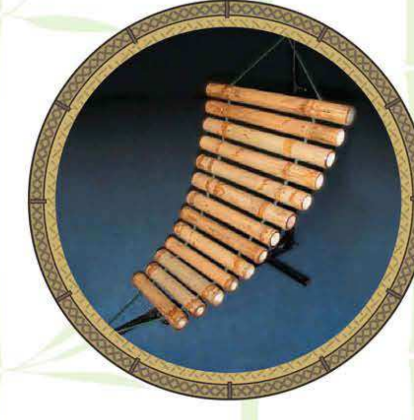
โปงลางไผ่ไผ่

“ปี่เสียงนก” เป็นปี่ชนิดหนึ่งที่มีแกนไม้เป็นคันชักตรงปลาย ดึงเข้าออกได้เพื่อเปลี่ยนเสียง เมื่อชักเข้าออก จะมีเสียงคล้ายนกนิยมนำทำด้วย “ไผ่ซาง”