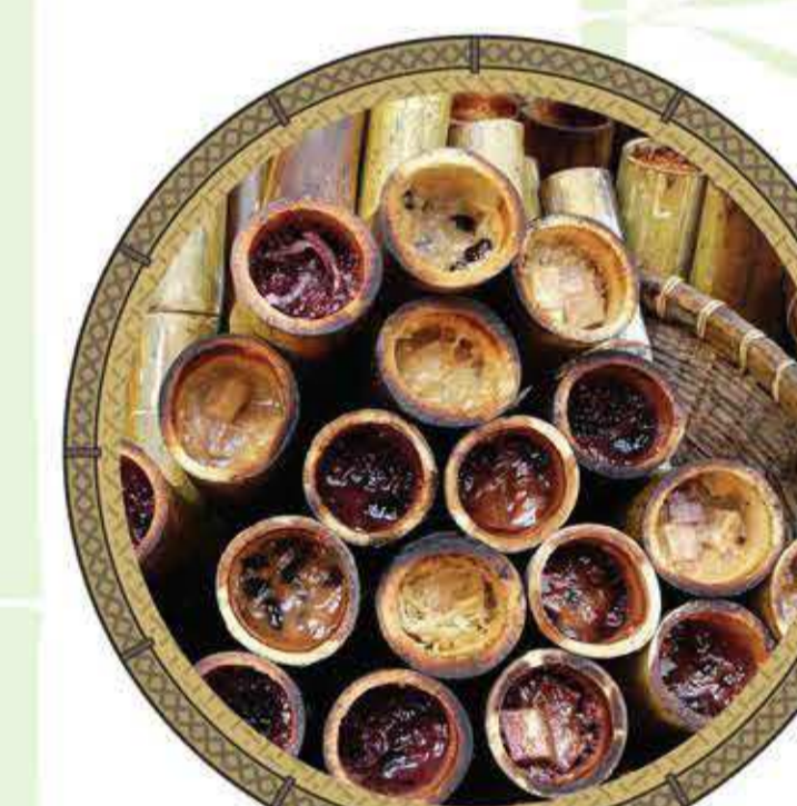
ข้าวหลาม