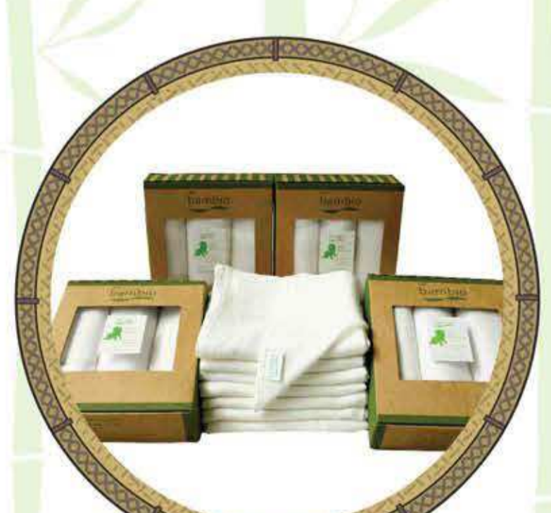
ผ้าใยไผ่

ผ้าใยไผ่ (Bamboo Fabrics) มีคุณสมบัติที่นุ่มนวล เงามาม มีลวดลายที่เกิดจากธรรมชาติของเส้นใยไผ่ ซึ่งเกิดขึ้นจากธรรมชาติ 100% ไม่ผสมสารเคมี ช่วยป้องกันแบคทีเรีย ป้องกันยูวี และยังสามารถปรับอุณหภูมิให้กับผู้สวมใส่