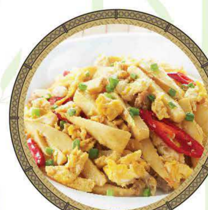
หน่อไม้ผัดไข่