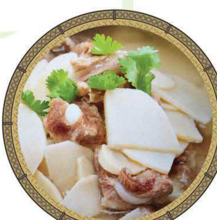
ต้มจืดหน่อไม้กระตือกหมู