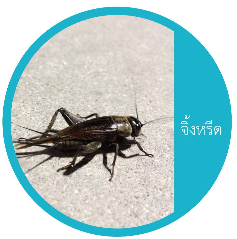
อันดับ ออร์โทพเทรา (Order Orthoptera) ตั๊กแตนหนวดยาว ตั๊กแตนหนวดสั้น ตั๊กแตนหนวดยาว จิ้งหรีด แมลงกระซอน