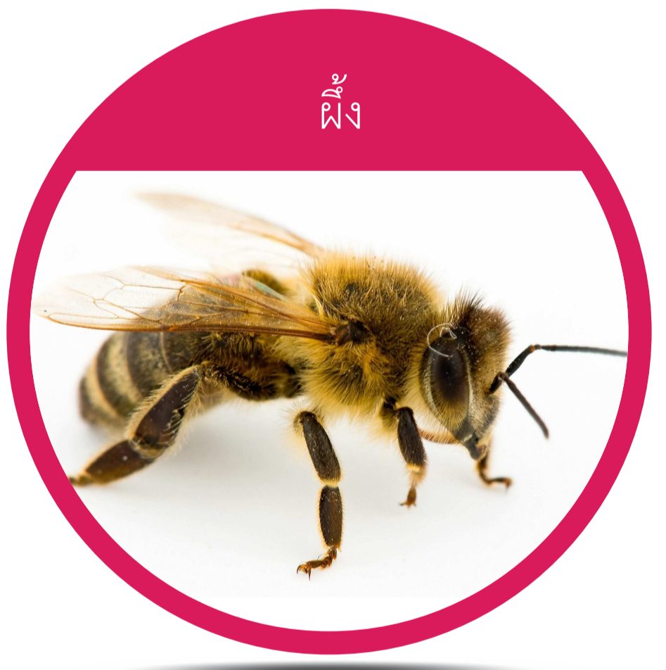
อันดับ ไฮเมนอพเทรา (Order Hymenoptera) ผึ้ง ต่อ แตน มด