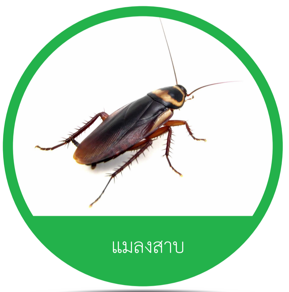
อันดับ เบลลโทเดีย (Order Blattodea) แมลงสาบ