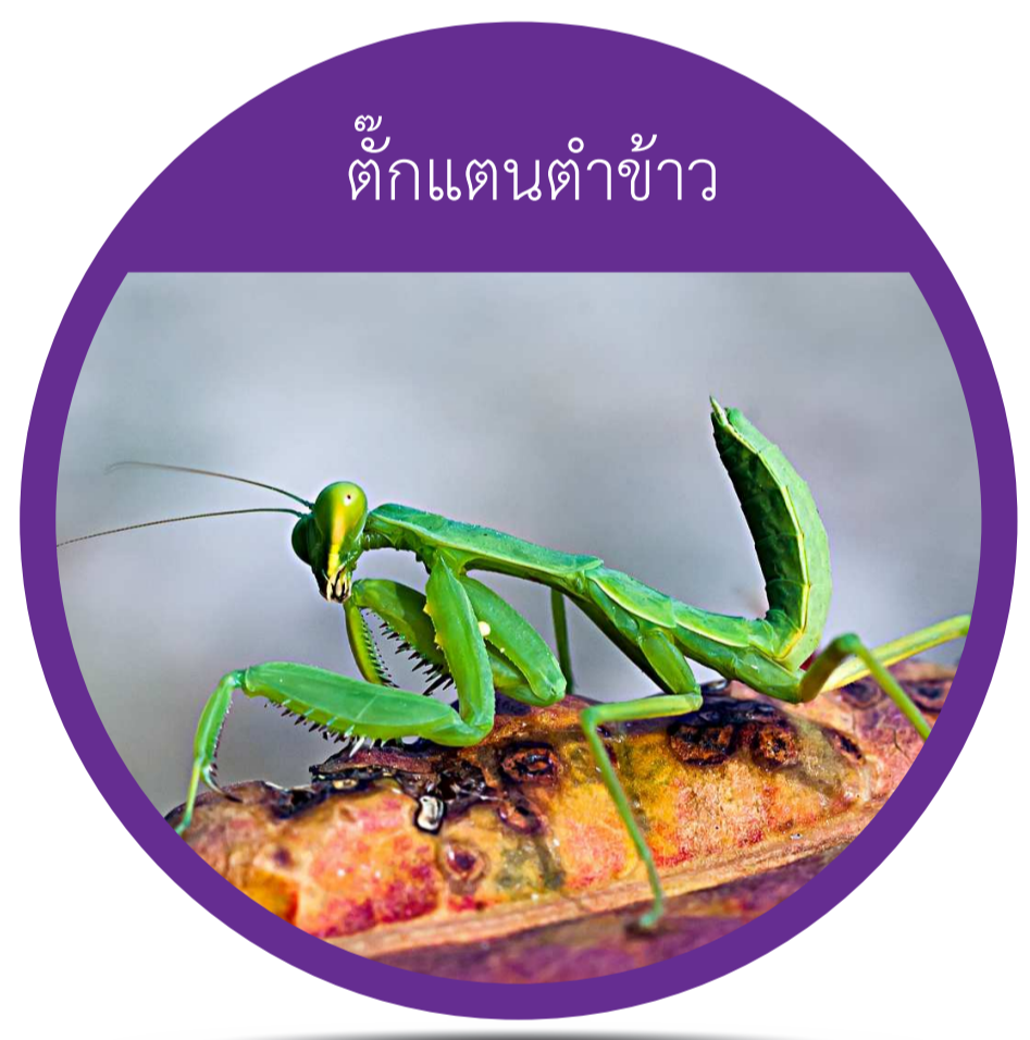
อันดับ แมนโทเดีย (Order Mantodea) ตั๊กแตนตำข้าว