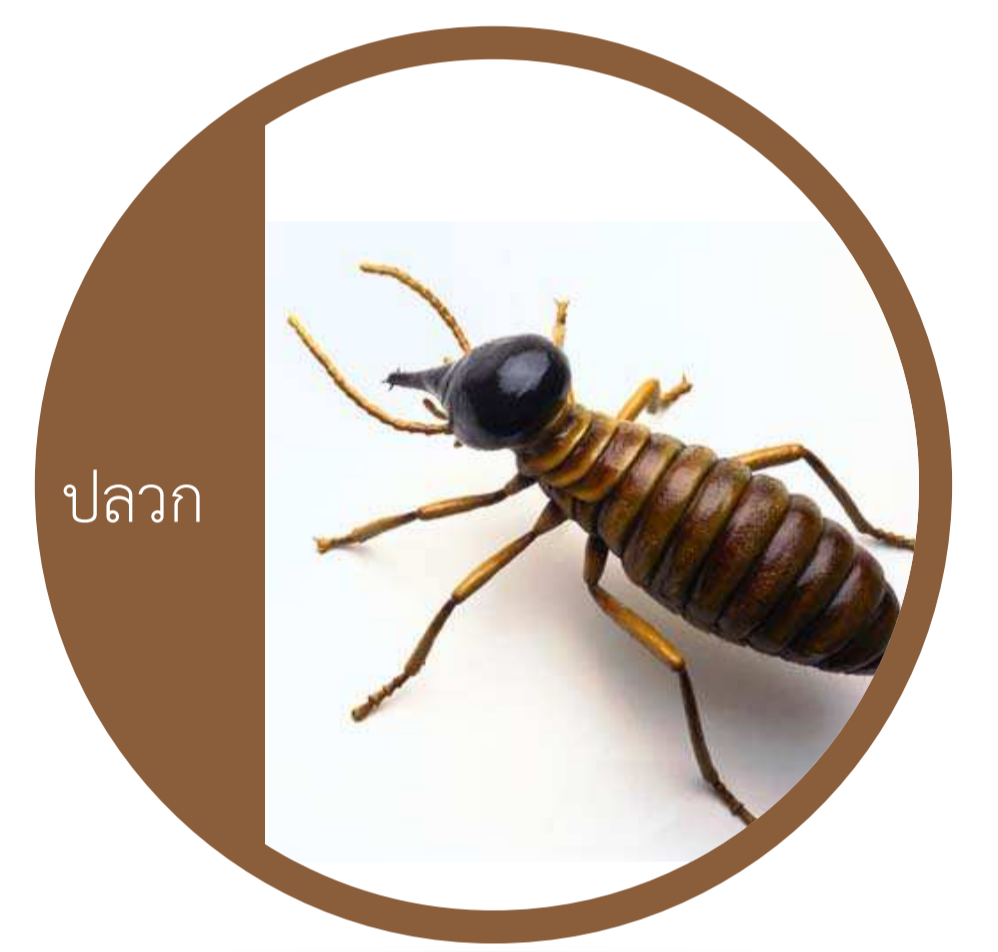
อันดับ ไอโซพเทรา (Order Isoptera) ปลวก