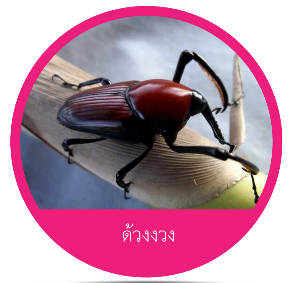
อันดับ โคเลอพเทรา (Order Coleoptera) ด้วงปีกแข็ง ด้วงงวง