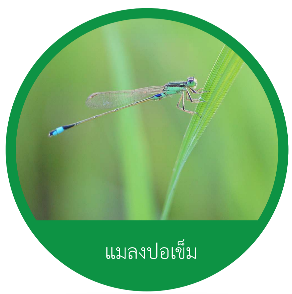
อันดับ โอดอนาตา (Order Odonata) แมลงปอเข็ม แมลงปอ

แมลงเป็นสัตว์ที่มีรูปร่างและขนาดที่หลากหลาย หากใช้ลักษณะเฉพาะของโครงสร้างปีก ปาก และลักษณะพิเศษอื่น ๆ จะสามารถแบ่งประเภทของแมลงได้ถึง 30 อันดับ (Order)* ซึ่งมีอันดับที่น่าสนใจ เช่น