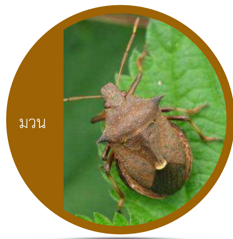
อันดับ เฮมิพเทรา (Order Hemiptera) มวน จักจั่น