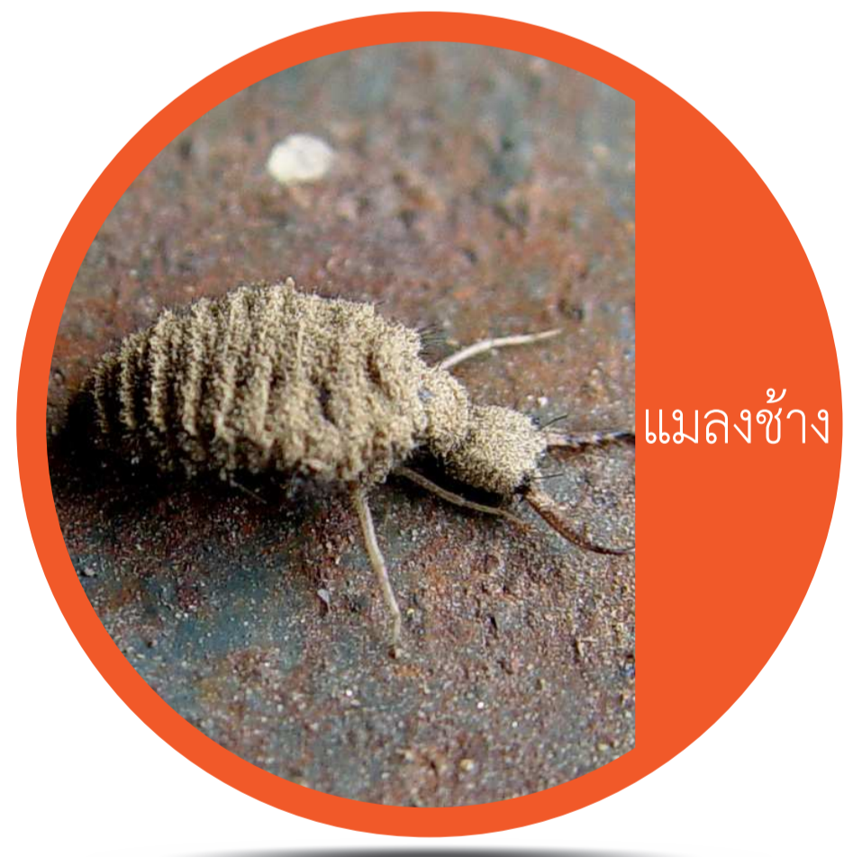
อันดับ นิวรอปเทรา (Order Neuroptera) แมลงช้าง