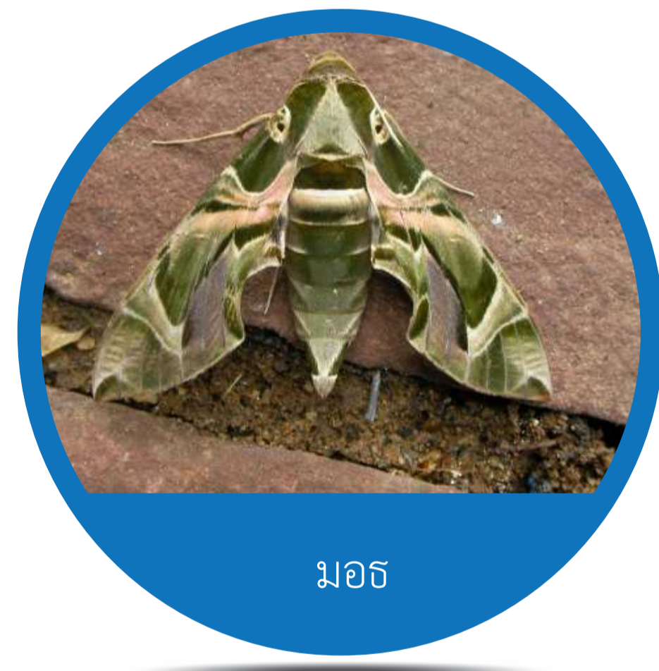
อันดับ เลพิโดพเทรา (Order Lepidoptera) มอธ ผีเสื้อ