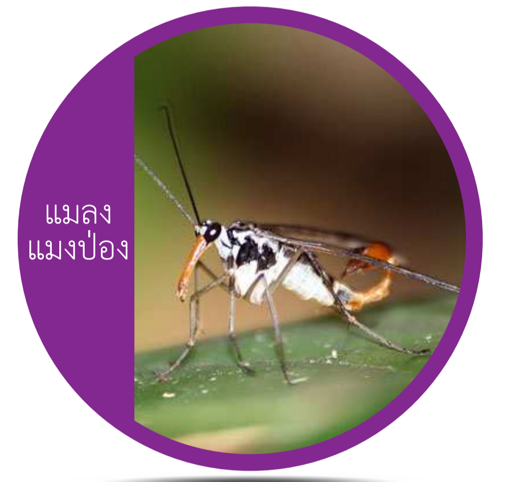
อันดับ เมคอปเทรา (Order Mecoptera) แมลงแมงป่อง