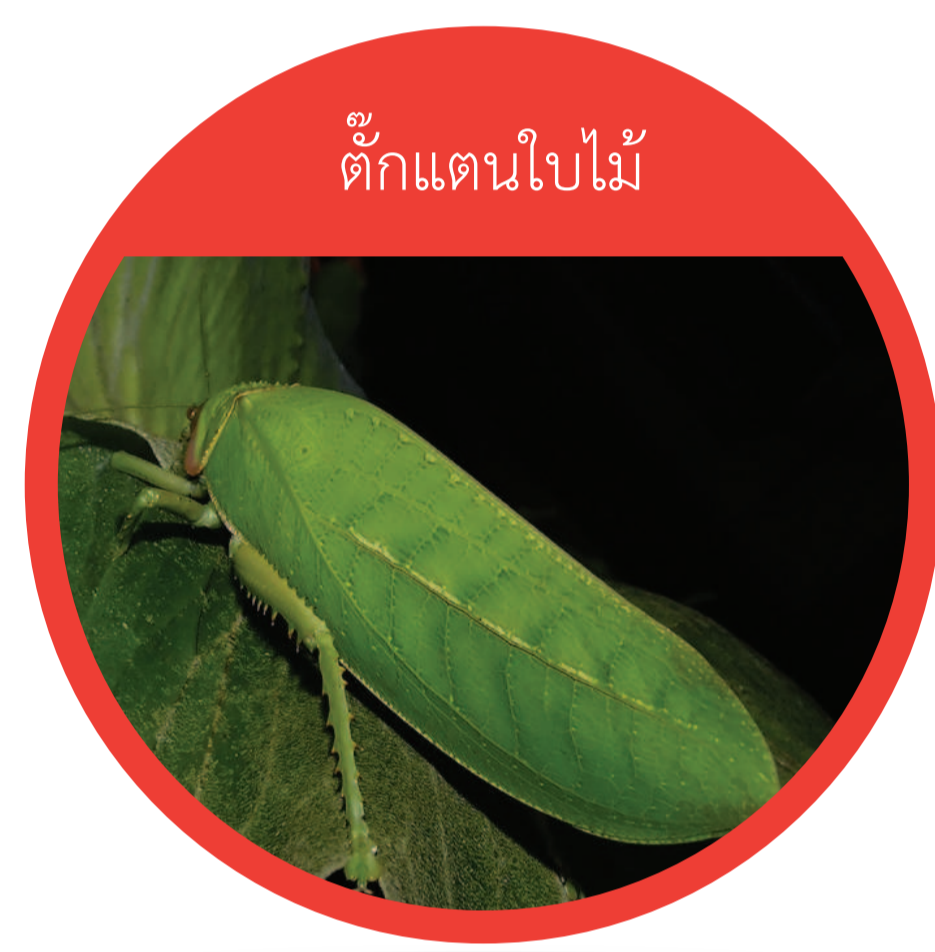
อันดับ ฟาสมาโทเดีย (Order Phasmatodea) ตั๊กแตนกิ่งไม้ ตั๊กแตนใบไม้