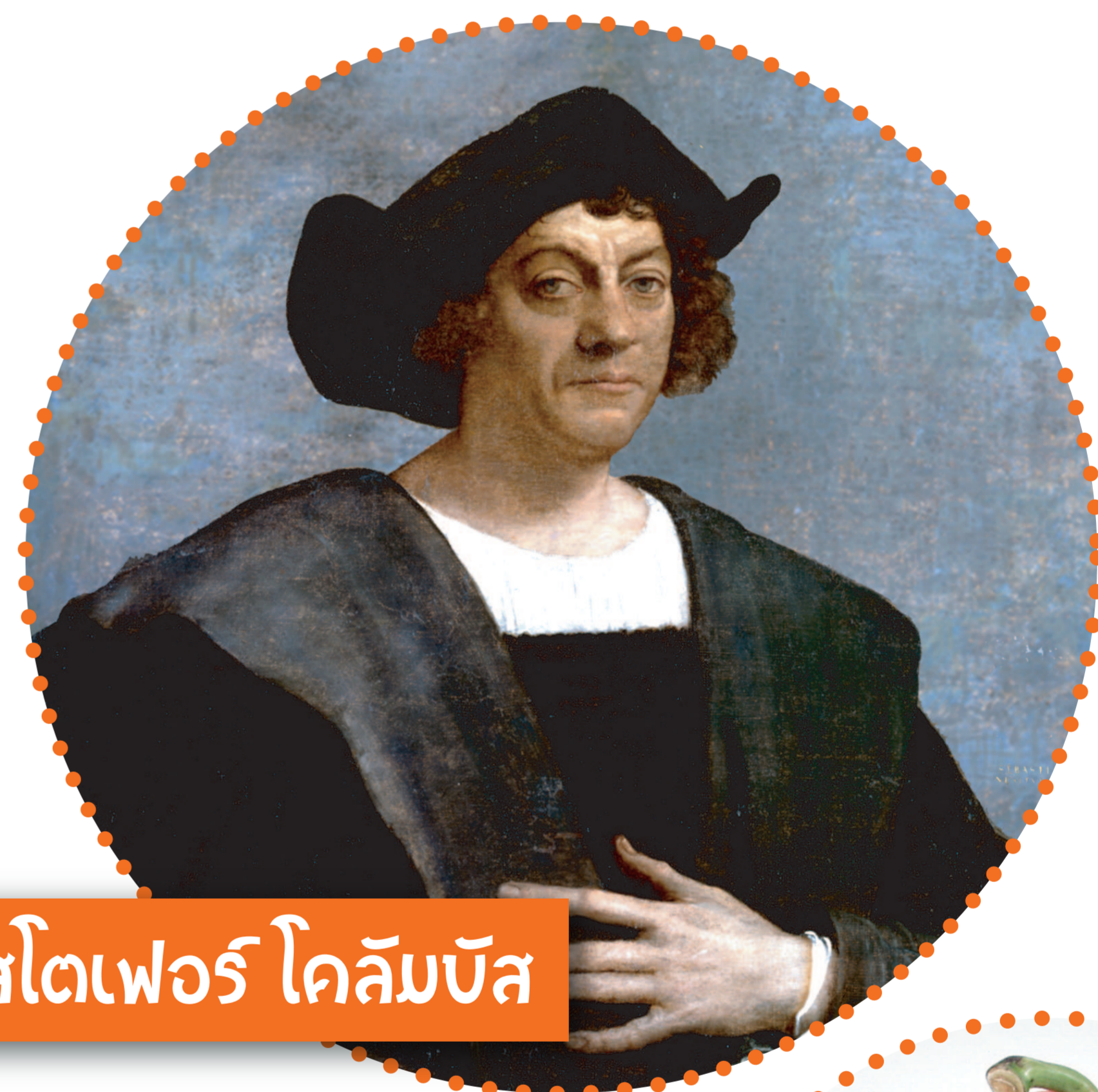
คริสโตเฟอร์ โคลัมบัส

พริกเดินทางจากทวีปอเมริกามาสู่ทวีปยุโรปโดย คริสโตเฟอร์ โคลัมบัส และคณะ เมื่อประมาณปี พ.ศ.2096 (ค.ศ.1553) ก่อนนำเข้ามายังทวีปเอเชียทางประเทศอินเดีย จากนั้นจึงเริ่มเข้ามาเผยแพร่ในประเทศจีน และในเอเชียตะวันออกเฉียงใต้ ประมาณปี พ.ศ.2143 (ค.ศ.1600)*