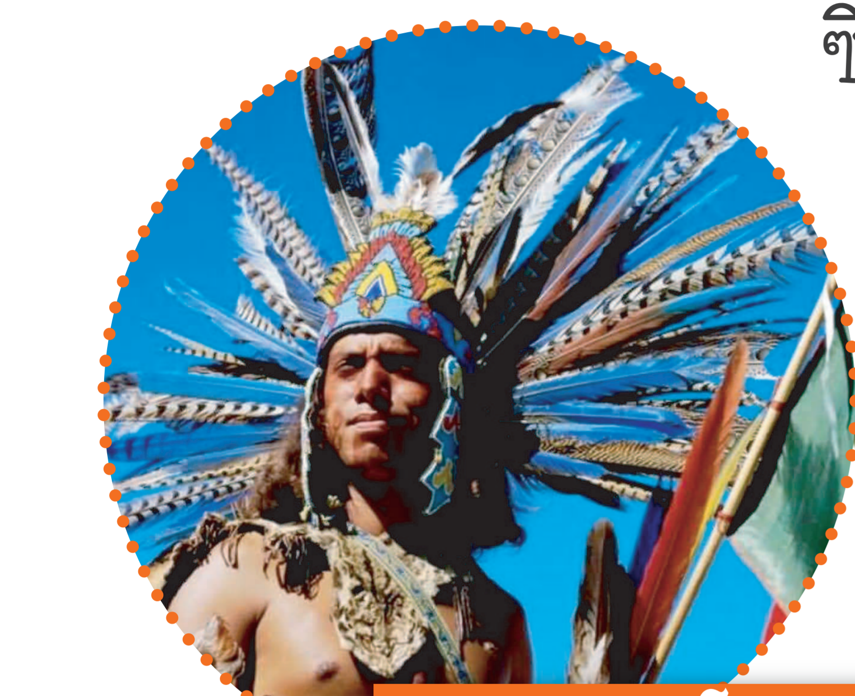
ชาวแอซเท็ก (Aztec)

นอกจากนั้นยังมีการค้นพบซากของต้นพริกที่มีอายุกว่า 2,000 ปีในทิวทัศน์ของประเทศไทยหรือแม้แต่ลายปักเสื้อผ้าของชาวอินเดียในเปรูก็มีลายปักเป็นรูปต้นพริก