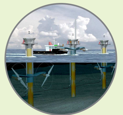
พลังงานน้ำขึ้นน้ำลง (Tidal Energy)

คือ การผลิตไฟฟ้าโดยอาศัยความแตกต่างระหว่างระดับความสูงของน้ำ ซึ่งเกิดจากปรากฏการณ์น้ำขึ้นน้ำลงตามธรรมชาติ หลักการผลิตกระแสไฟฟ้านั้นจะอาศัยจังหวะที่น้ำขึ้นน้ำลงจะไหลเข้าไปสู่อ่างเก็บน้ำผ่านกังหันน้ำ และเครื่องกำเนิดไฟฟ้า เมื่อน้ำลงน้ำจะไหลออกจากอ่างเก็บน้ำนี้ทางช่องทางเดิม