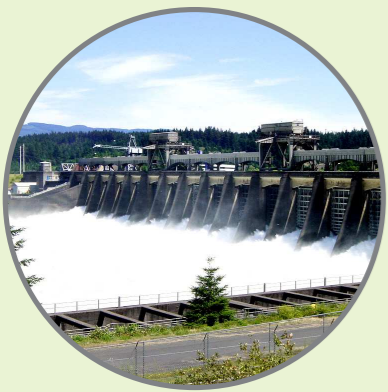
พลังงานน้ำตก หรือ พลังงานน้ำจากเขื่อน (Hydro Energy)

“น้ำ” พลังงานประสิทธิภาพสูง สามารถนำมาใช้ผลิตกระแสไฟฟ้าได้รวดเร็วและเป็นมิตรต่อสิ่งแวดล้อม ที่สำคัญคือ “น้ำเป็นแหล่งพลังงานตามธรรมชาติซึ่งมีหมุนเวียนให้ใช้อย่างไม่มีวันหมด”