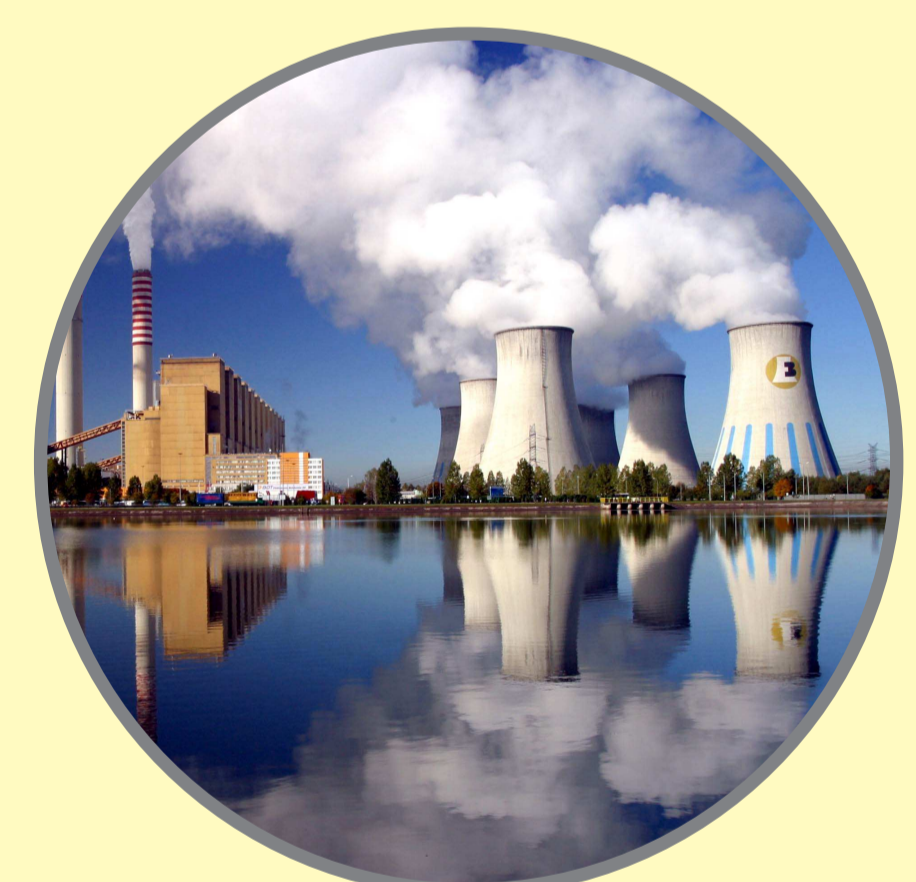
โรงงานไฟฟ้าพลังงานถ่านหิน (Coal power plant)

“ถ่านหิน (Coal)” เกิดมาจากซากพืชที่ทับถมและถูกปิดทับด้วยชั้นตะกอน เมื่อเวลาผ่านไปประมาณ 5,000 ปี ซากพืชจะเปลี่ยนเป็น “พีท (Peat)” ต่อมาพีทได้รับความร้อนและความดันที่เพิ่มขึ้นจึงแปรสภาพไปเป็น “ถ่านหิน” ซึ่งนับเป็นทรัพยากรเชื้อเพลิงสำคัญในอุตสาหกรรม