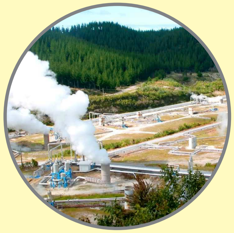
โรงงานไฟฟ้าพลังงานความร้อนใต้พิภพ (Geothermal power plant)

“พลังงานใต้พิภพ” ขุมทรัพย์สำคัญที่เกิดจากการบ่มเพาะทางธรรมชาติ จนได้ออกมาเป็นแหล่งพลังงานสำคัญ 3 รูปแบบ คือ “พลังงานความร้อนใต้พิภพ ปิโตรเลียม และถ่านหิน”